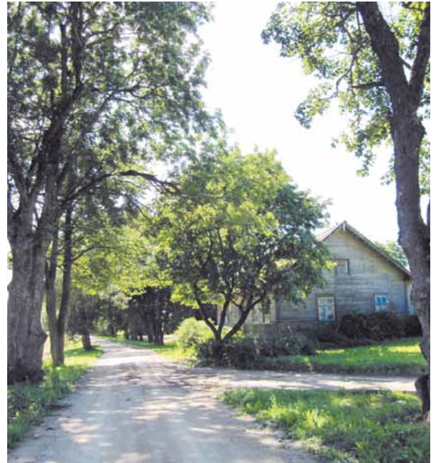
Puiesteeks kujundatud Vao küla läbiv teelõik

Talurahvaarhitektuuri ehedaim näide oli Mihkli talu Tahkuna poolsaarel. Talu vanimad hooned mäletavad veel