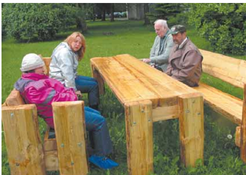
Hooldekodu elanikel on nüüd oma koht, kus ilusa ilma korral jalga puhata.

Traditsiooniliselt oli põlumeeste selts Pandivere päeval oma toodanguga esindatud – lille-, tomati- jt taimi, teraviljasaadusi, õmblustooteid, käsitööd, taluvõid ja -piima. Pidasime kohvipoodi, kus pakuti kohvi, tee, piima ja kisselli kõrvale koduseid küpsetisi ja võileibu.