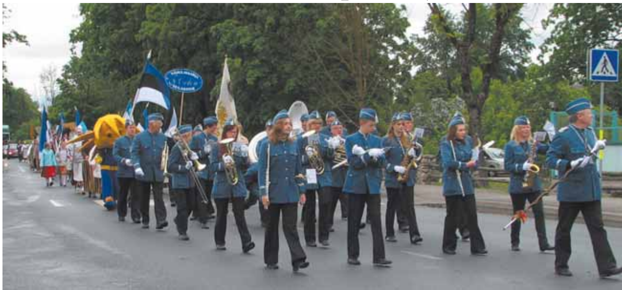
Väike-Maarja pasunakoor Pandivere päeva rongkäigus