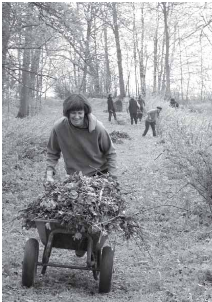
Korrastatud ilme sai ka tikriallee.

Kohtuda valla esindajatega transpordi küsimustes. Esitada vallale ettepanek kohustada kohalikke ärimehi oma maad ja