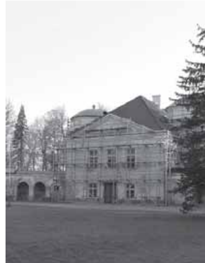
Kiltsi mõis tellingutes. Mai 2009

Kokkuleppel AS Ervin Ehitusega tegi projektijuht külalistele mõisas ringkäigu ja andis seletusi Norra finantsmehhanismide kohta, tänu millele suur restaureerimine Kiltsi lossis võimalikuks sai, varasemate remonttööde kohta lossis, OÜ Mõisaprojekti koostatud sisekujundusprojekti, arheoloogiliste väljakaevamiste ning tööde edenemise ja ette tulnud muudatuste kohta ning ümberprojekteerimise kohta, mis peagi lõppemas. Tudengid tundsid huvi Kiltsi mõisa ajaloo ja lossi ehitamise erinevate etappide vastu. Nende tähelepanu köitsid restauraatorite poolt välja puhastatud rohked maalüngud ja keerulised krohvikinnitused. Külalised rõhutasid, et neid huvitab just selline restaureerimistööde etapp, kus ajalooline pind on väljapuhastatud, kuid lõplikku viimistlust ei ole veel tehtud.