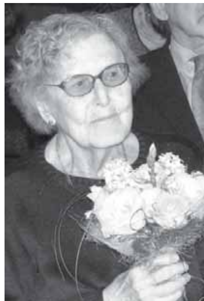
Ilse Lehiste Wiedemanni keelepäeval Väike-Maarjas