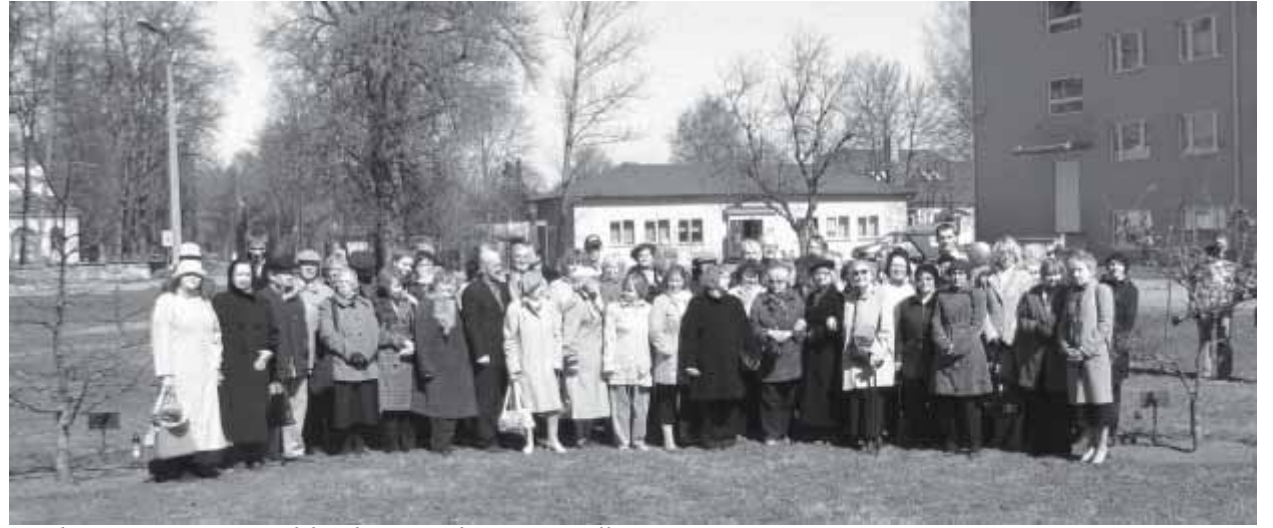
Keelepäevast osavõtjad keeletammikus.

Käesoleva lehe 3. ja 4. leheküljelt leiad Pandivere päeva ristsõna. Ootame rohkeid lahendusi!