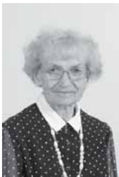
nr 178 Valve Toming