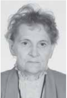
nr 201 Mall Vöhandu, Kiltsi põhikooli õpetaja