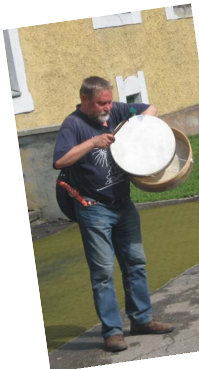
Enne ametlikku avamist korraldas

18. ja 19. juulil toimusid Väike-Maarjas Eesti Vabariigi 90. aastapäevale pühendatud rahvakultuuri päevad. Reedel, 18. juulil esinesid lõõtsamängijad ja kapellid, laupäeval oli tantsu- ja koorilaulupäev. Üritust toetas Riigikantselei.