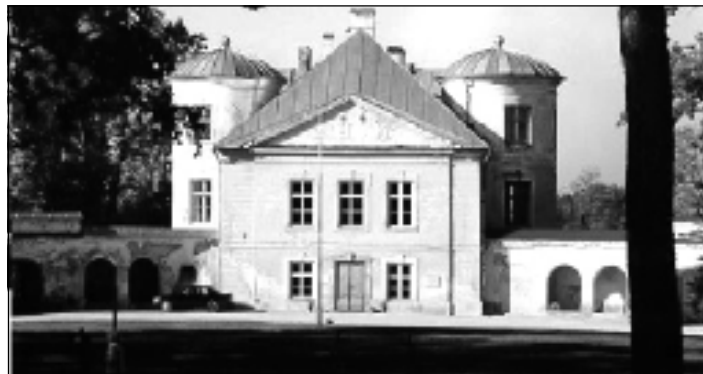
Kiltsi loss ootab külastajaid

Kindlasti võtab aga Kiltsi külastajaid vastu ka teistel päe- vadel. E-T kella 8.00-13.00; K- R 8.00 – 19.00; L-P 11.00-19.00 – teistel aegadel kokkuleppel telef/fax 325 3411; e-mail: kiltsipk@v-maarja.ee Laupäe- val-pühapäeval on tagatud ja- lutuskäik mõisas koos giidiga,