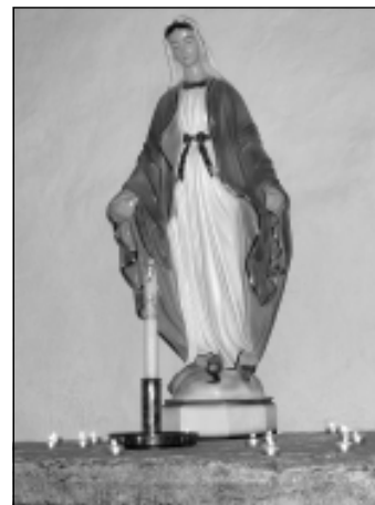
Paekonverentsi käigus avati Väike-Maarja kirikus kesk-aegne renoveeritud paekivist altar