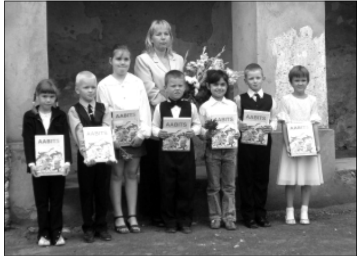
Kiltsi kooli I klass uhiuute aabitsatega esimesel koolipäeval