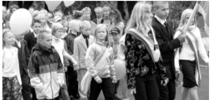
1. septembril kogunesid valla koolide õpilased Väike-Maarjasse kooliaasta alguse ühisesse rongkäiku