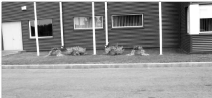
Loomsete Jåätmete Kåitlemise ASi iseloomustab alati puhas ja korras ettevõtte territ