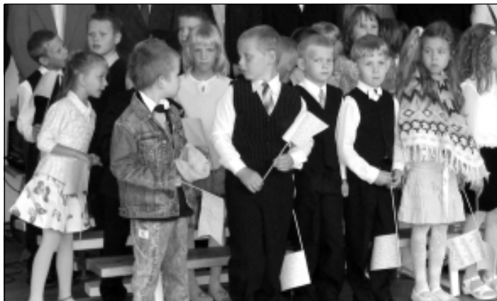
Väike-Maarja gümnaasiumi esimeste klasside õpilased kogunesid kooliaasta avaaktuseks