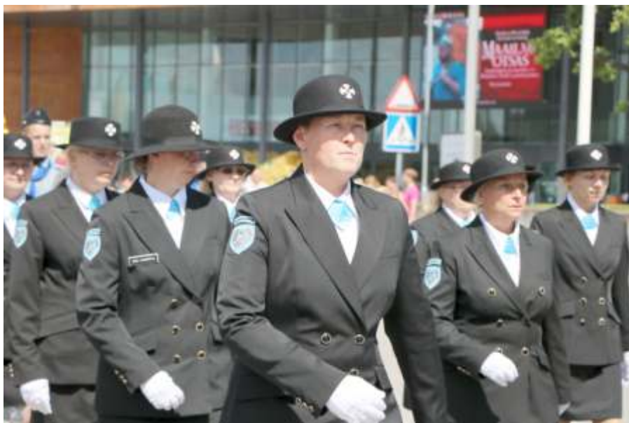
Käesolev näituseprojekt kannab sõnumit, et Naiskodukaitse katab ühtse ja aina tiheneva turvavaibana kogu riiki.