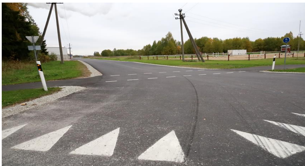
Kaarma tööstusala tee