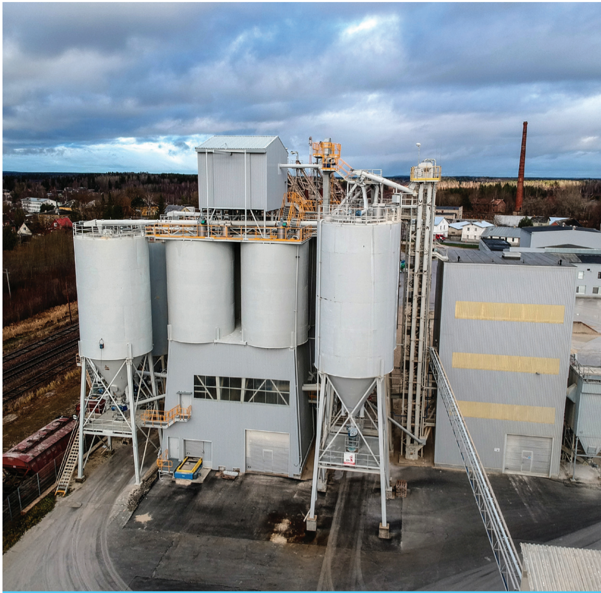
Esiplaanil lubjakivi peenfraktsiooni tootmisliini II ehitusetapp (FiRak II).

ja seitse päeva nädalas, siis tänavu oleme pidanud tegema juba mitmeid seisakuid ja vaadates ettepoole, sama olukord jätkub. Seda juba eespool öeldud põhjustel, aga ka seetõttu, et nii meie, kui ka meie klientide toomised, on CO2 emissioonirikad ettevõtmised, ja Euroopa Liit ei ole siiani suutnud kehtestada kolman-