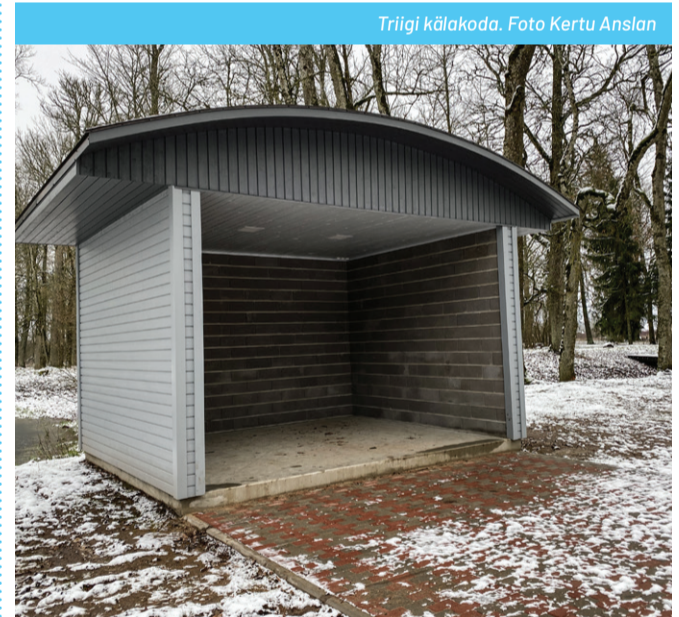
Triigi külakoda.