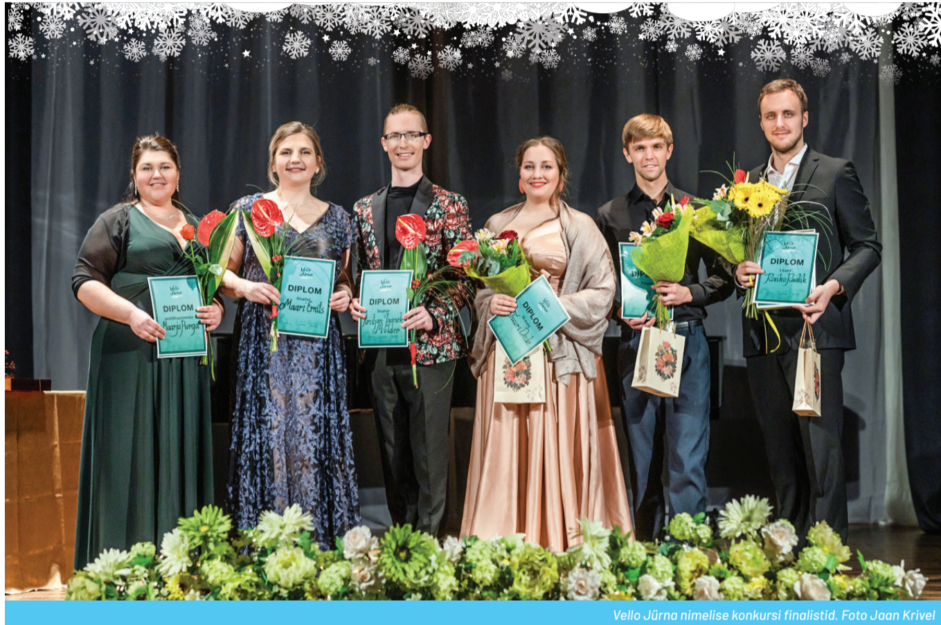
Vello Jürna nimelise konkursi finalistid.

Väike-Maarja Muusikakooli suured ja väikesed muusikud tõid 25. novembril