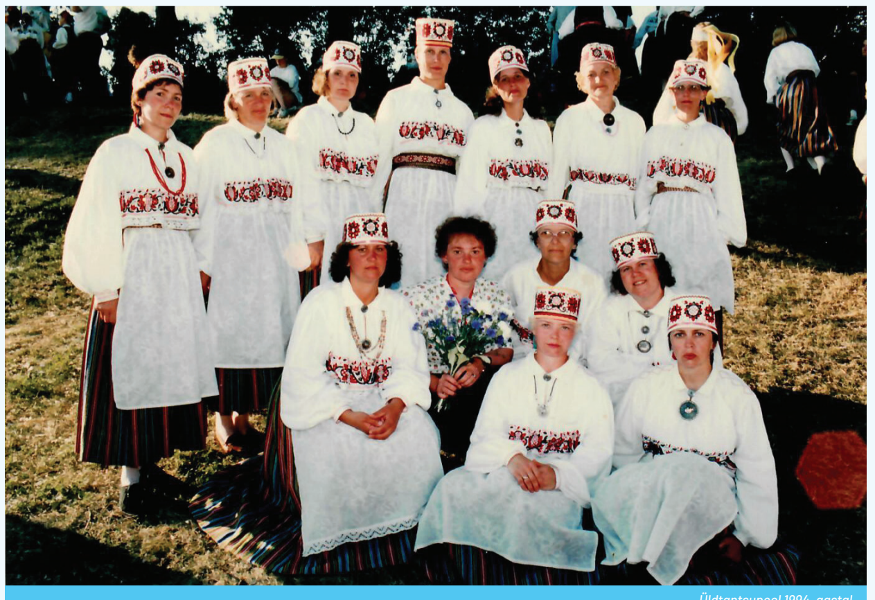
Üldtantsupeol 1994. aastal.