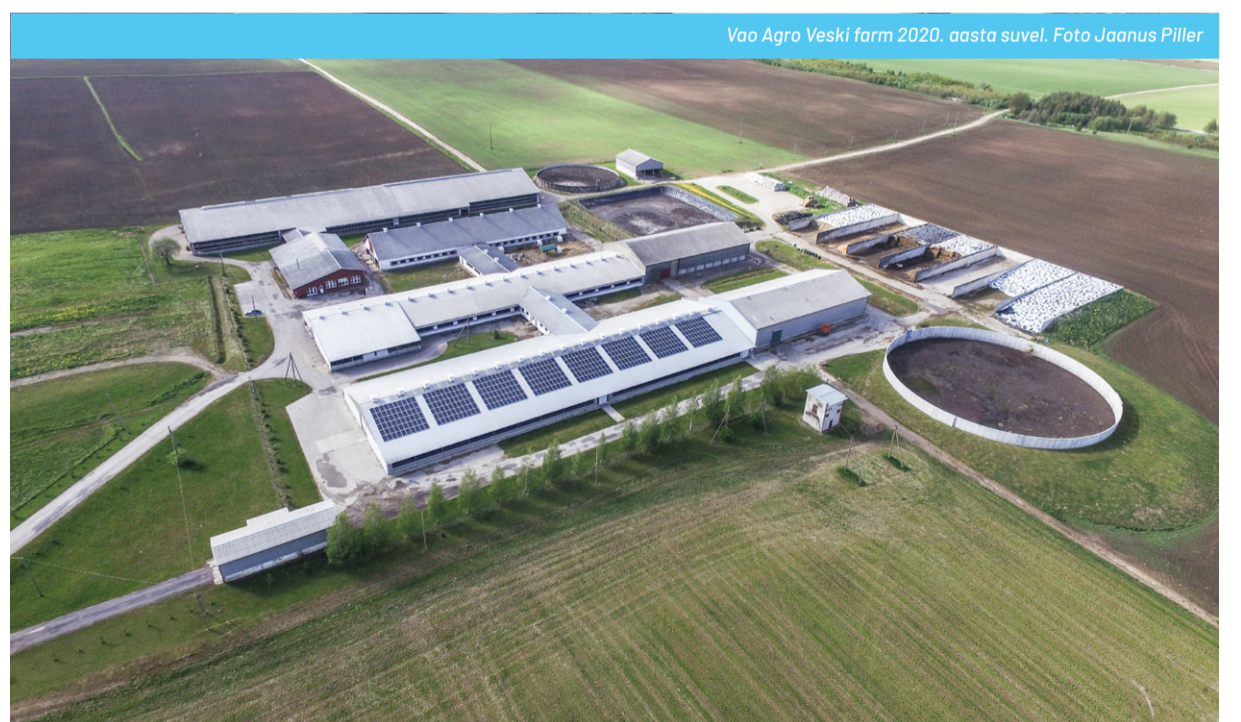
Vao Agro Veski farm 2020. aasta suvel.

Tänu tublile personalile oleme suutnud sama arvu töötajatega suurendada oluliselt nii karja kui