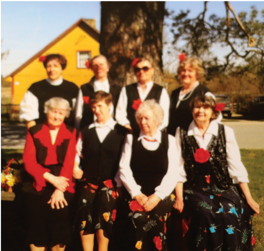
2014. aastal Roelas.