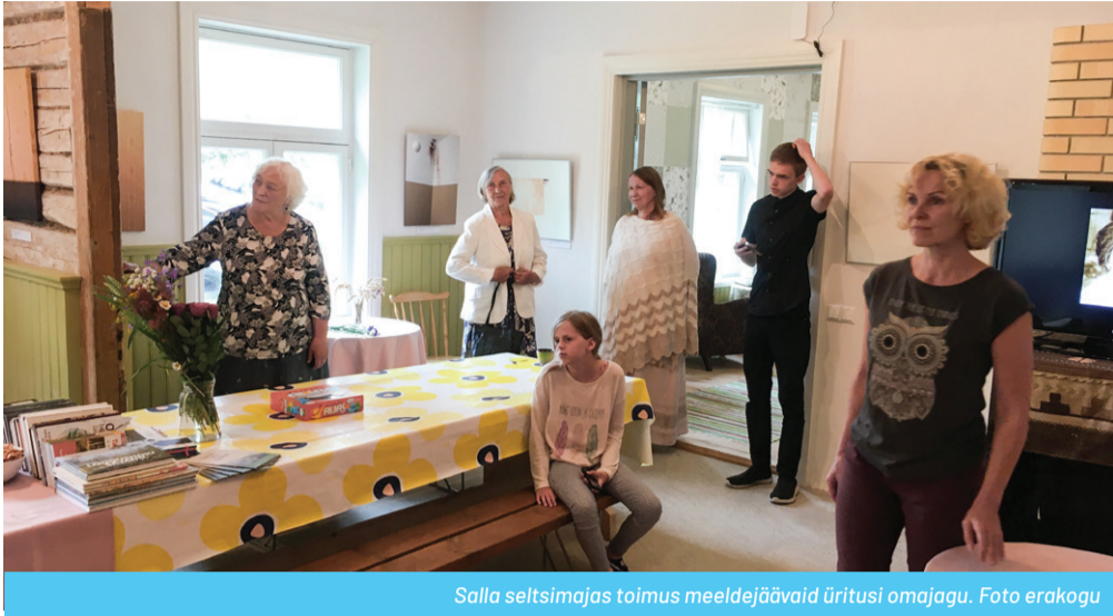
Salla seltsimajas toimus meeldejäädav üritusi omajagu.

Tuleval aastal on plaanis kõigi teenuste ja õnnestunud ürituste korraldamisega jätkata. Kindlasti soovime roh-