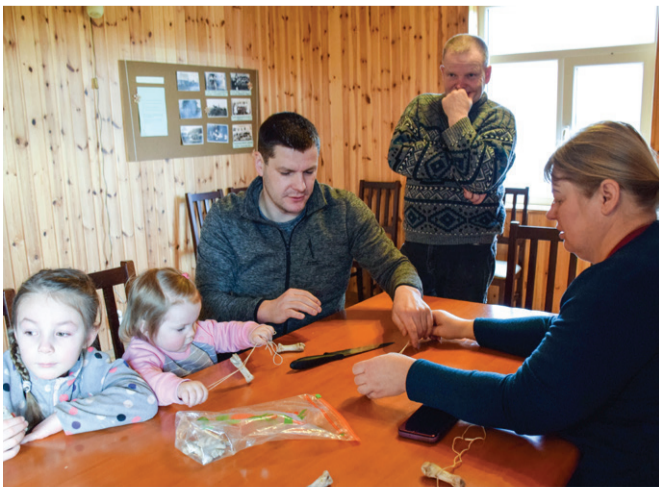
Vurri õpituba vastlapäeval.