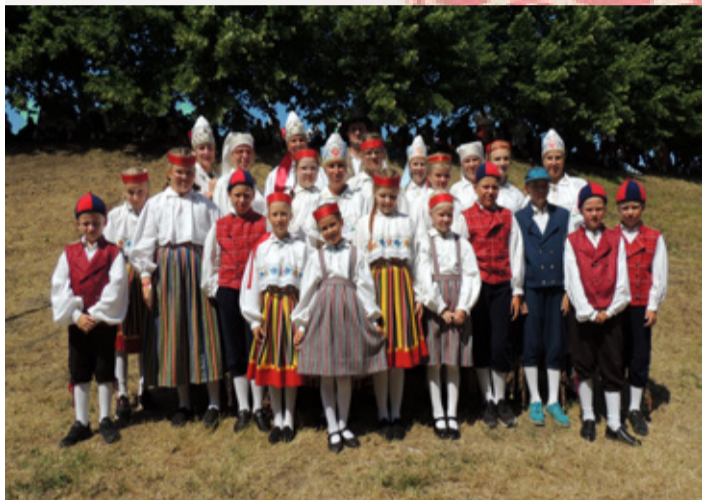
Rakke kultuurikeskuse pererühm.