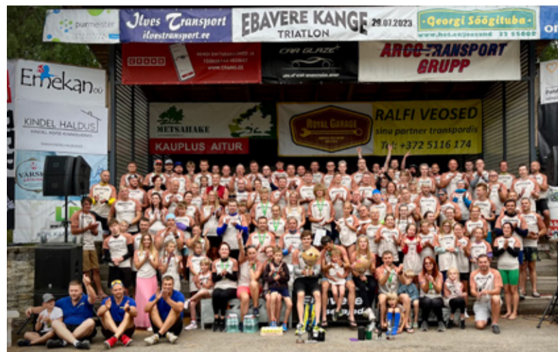
Ebavere Kange triatlonil osalejad ühisfotol.