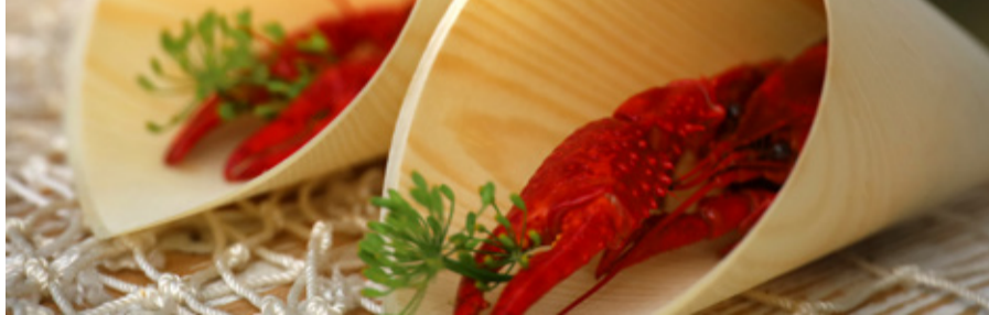
Külastajatele pakuti erinevaid vähjarooasid.

5. augustil peeti Lääne-Virumaal Ao külas Wähja festivali, kus tutvustati eestimaist jõevähki – kes see iidne jõeloom on, kuidas teda jätkusuutlikult püüda, valmistada ja süüa.