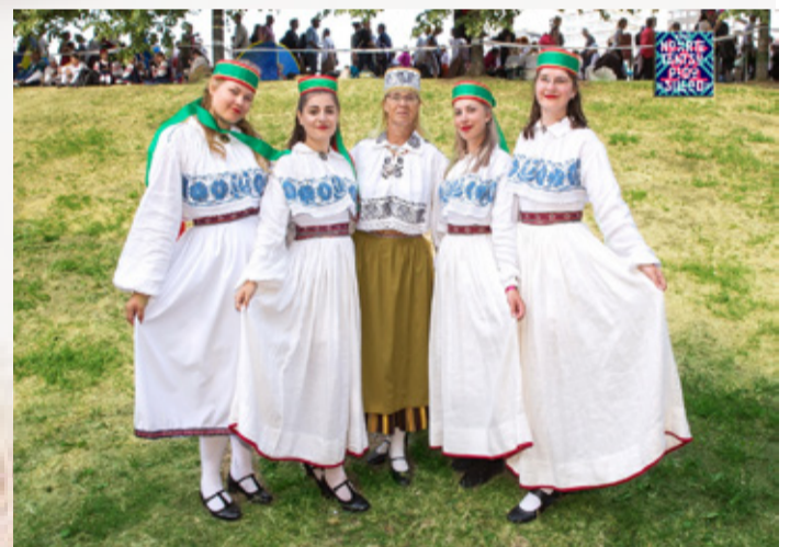
Väike-Maarja gümnaasiumi neidude rühm.