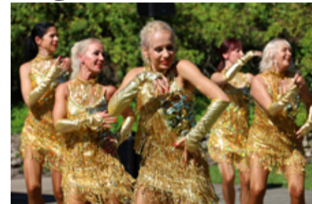
Tantsuetendus trupilt Panter.

Simuna noortekeskus oli sisse sättinud mõnusa lebola, kus sai sõpradega hubaselt päeva nautida. Rohkelt huvilisi tiirles ka Simuna vabatahtliku tuletõrje seltsi päästeauto ümber, kus kohalikul päästjad jagasid ennetusala infot.