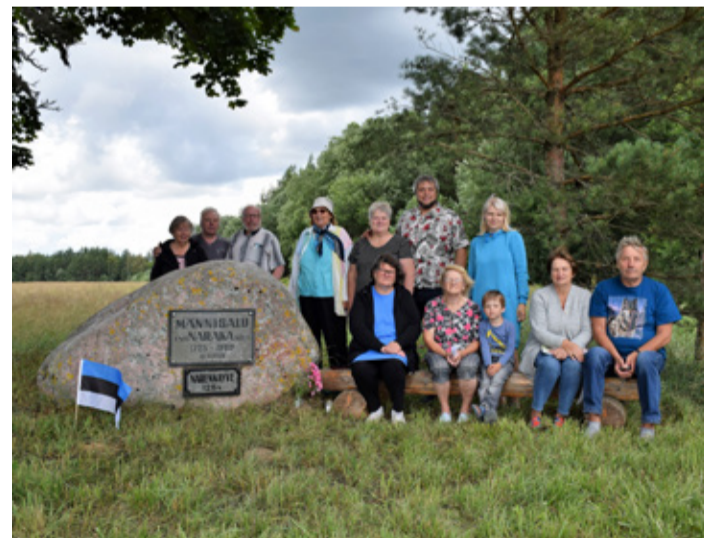
Tänavu täitus 30 aastat Männisalu mälestuskivi avamisest. Kokkulekud toimuvad siiani igal aastal.