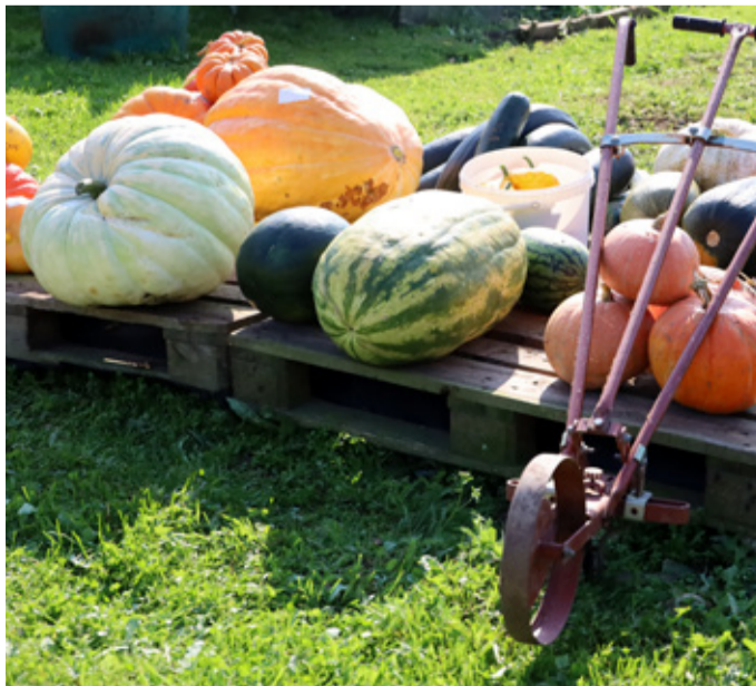
Kogukonnaüritus kõrvitsapäeva näol toimub kolmandat korda.

Kaire Kislov Maretaru-Uuetoa talu perenaine