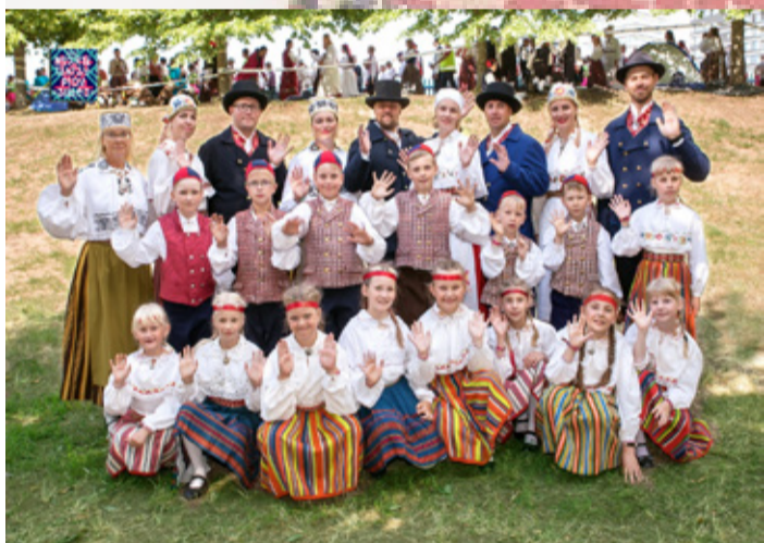
Väike-Maarja gümnaasiumi pererühm.