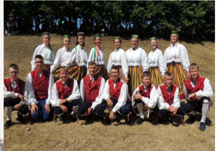
Rakke kultuurikeskuse 7.-9. klassi segarühm.