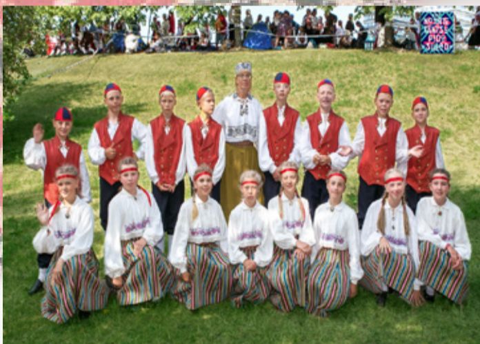
Väike-Maarja gümnaasiumi 1.-4. klassi segarühm.