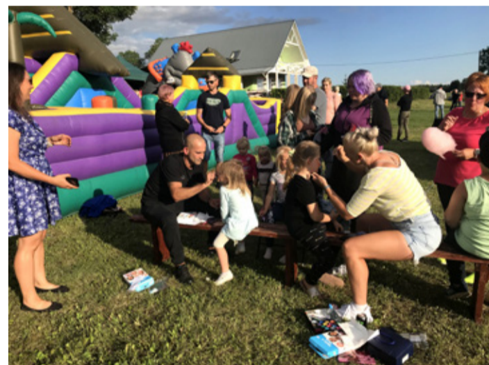
Perepäeval toimus sotsialiseerumine nii erinevate külade laste kui täiskasvanute seas

Nelli Lusmägi, Reelika Möldre, Siret Stoltzen