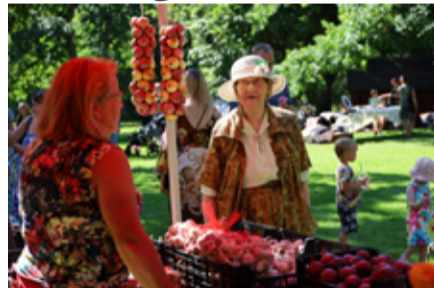
Laat oli tänava eriti mitmekesine.