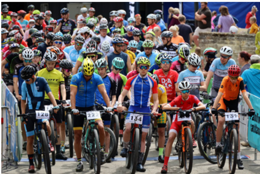
Pandivere rattasõit pakkus osalejatele põnevaid väljakutseid.

Pärast esimest ringi hakkas meist mööduma tulnukalaadseid, tundmatu- seni muutunud või õigemini üllatavalt üksteisesarnaseid ja paksu mudakihiga kaetud rattureid. Märkimisväärne on ka see, et põhisõidu ratturid ei saanud ainult vihma, nende üllatuseks oli ühele rajalõigule veetud juunikuus midagi