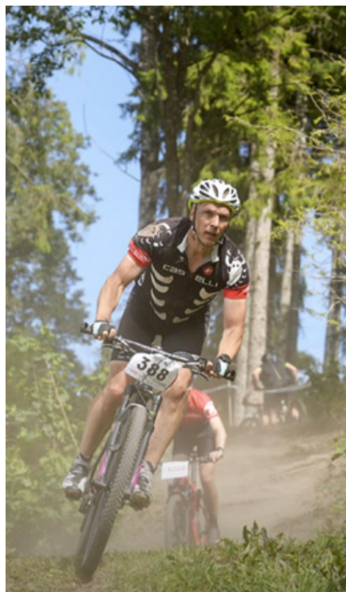
Sõidurõõm Rakke rattamaratonil.

Traditsiooniliselt oli Väike-Maarja vallavalitsus juulikuus kollektiivpuhkusel ning aitäh mõistmise eest, kellel oli mõni tegevus seetõttu pausil. Kuna meie allasutusest lahkus teedespetsialist, tuli tema tööülesandeid ringi jagada teiste teenistujate vahel. Sain ka ise ühendada oma hobi, jalgrattasõidu ja kruusteede remonttööd. Olulisemad asfaltteedega seotud investeeringud toimusid käesoleval suvel Eipri teel, Aburi – Kännuküla teel ja Rakke – Räätsvere tee-