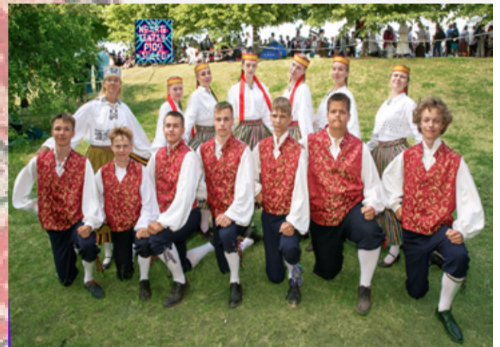
Väike-Maarja gümnaasiumi 7.-9. klassi segarühm.