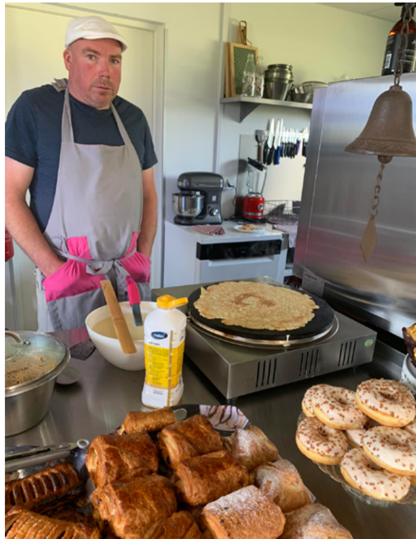
Mart satub Lambalauda kohvikusse vahel pannkooke küpsetama.