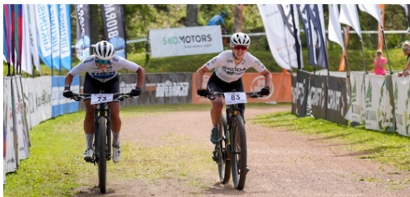
Rakke rattamaratoni naiste finišiheitlus.