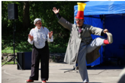
Piip ja Tuut naerutasid nii noori kui vanu.

Keskpäeval andsid Piip ja Tuut etenduse „Piip ja Tuut kontserdil“. Oma vahetu esinemisega võlusid ja naerutasid nad nii noori kui vanu külalisi.