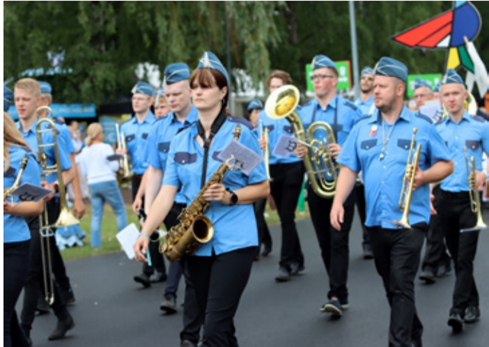
Väike-Maarja pasunakoor XIII noorte laulu- ja tantsupeo rongkäigus.