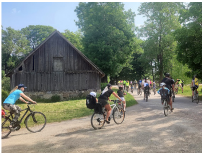
Rattaga sõideti läbi kuus küla.