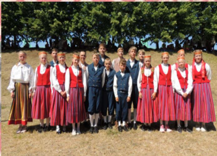
Rakke kultuurikeskuse 5.-6. klassi segarühm.