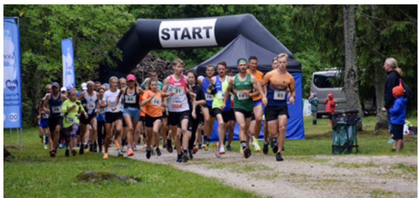
Emumäe jooksu start.