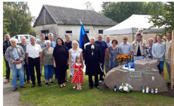
Arnold Jürgensi kivi avamine Ao külas.