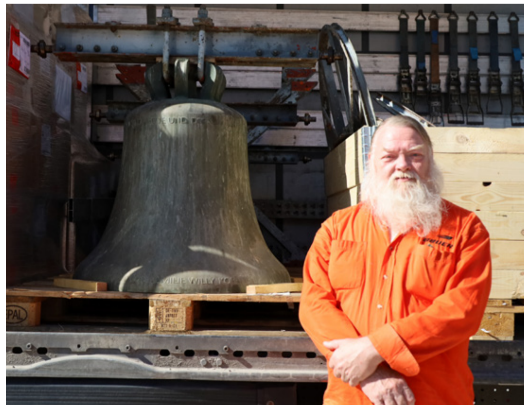
Ervin Pill Saksamaalt ostetud pronkskelladega.

Kas see on tavapärane, et inimene nii suure annetuse