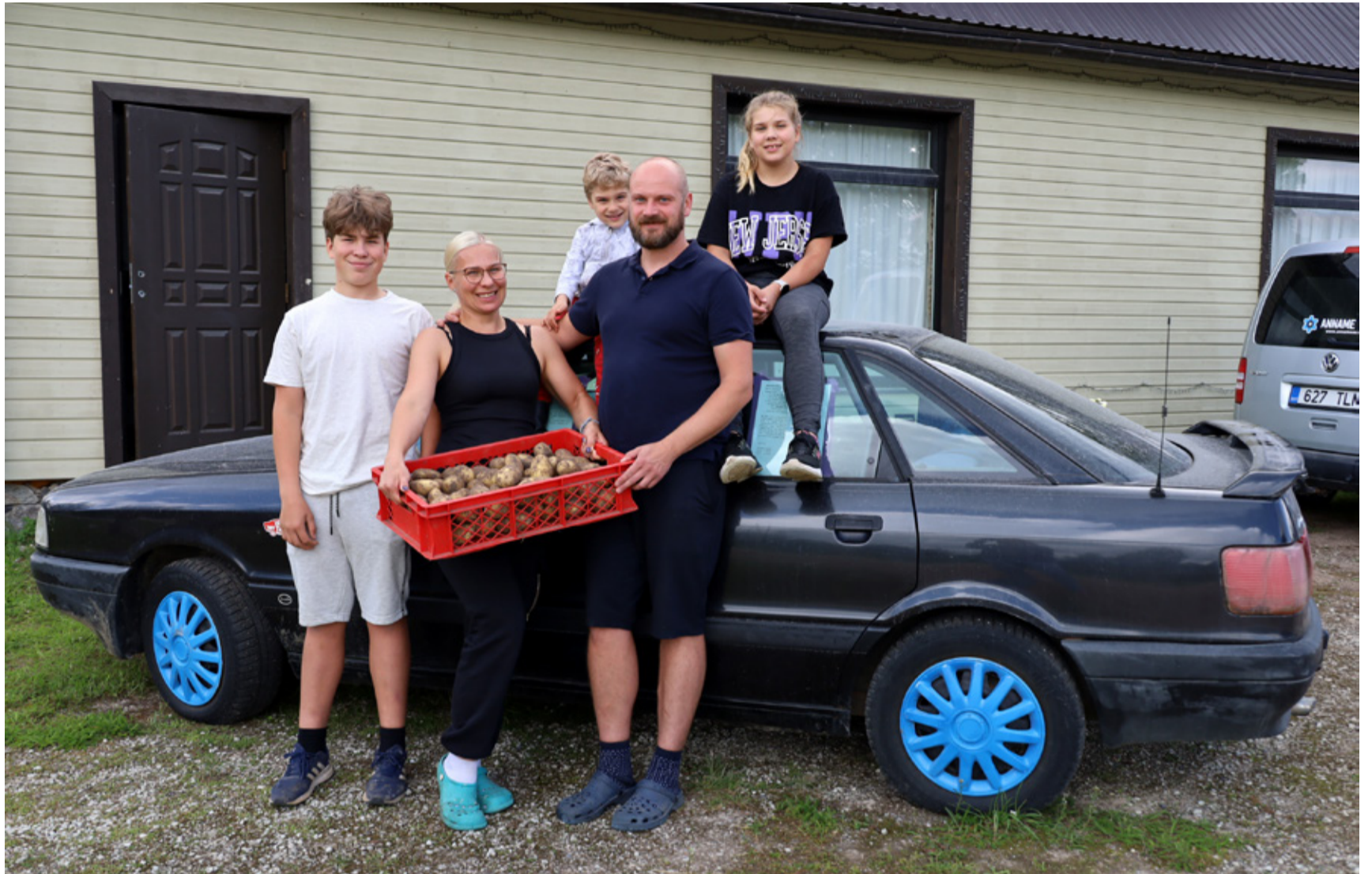
Perekond Vaarma oma uhke kartuli Audi taustal.

Keskmine pere keedab korraga kaks kuni kolm kilogrammi kartulit, teadis