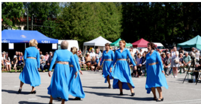
Kultuurikandjate kontsert on alati olnud päeva üks osa.

Õhtu lõppes tantsuõhtuga, kus jalga sai keerutada Eesti Guni ja Liisa saatel.