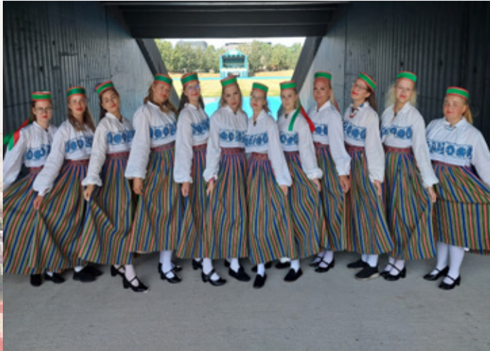
Rakke kultuurikeskuse neiduderühm.