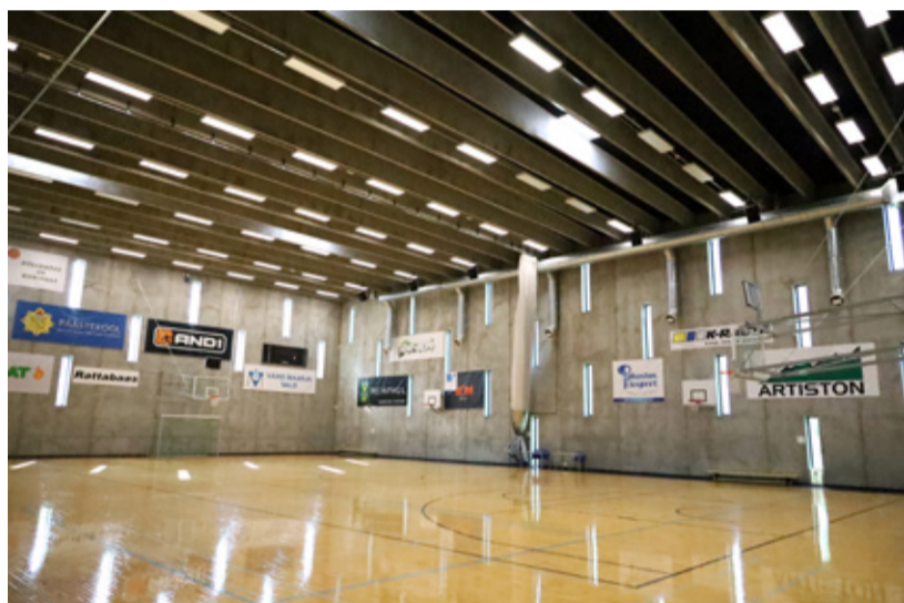
Pallimängude saalis saab kasutada erinevaid valgusrežiime mitmete spordialade jaoks.