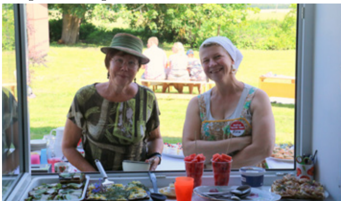
Kärü küla sartsakad inimesed külalisi kostitamas.