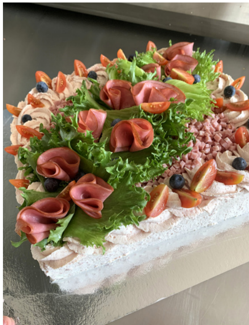
Lambalauda kohvikust saab muuhulgas tellida magusaid ja soolasid torte.