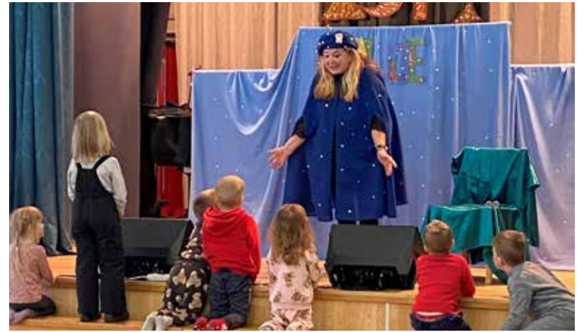
Anne Velli lustakas ja õpetlik teatrietendus.