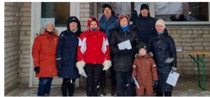
Rakke Trimmil tublimad.

Traditsiooniliselt loosime ka kõikide osaluskaartide vahel ühe kopsakama loosiauhinna. Nagu sellisel puhul ikka on,