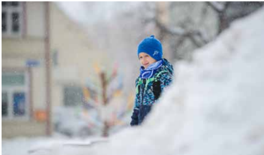
Laps lumevalli varjus.