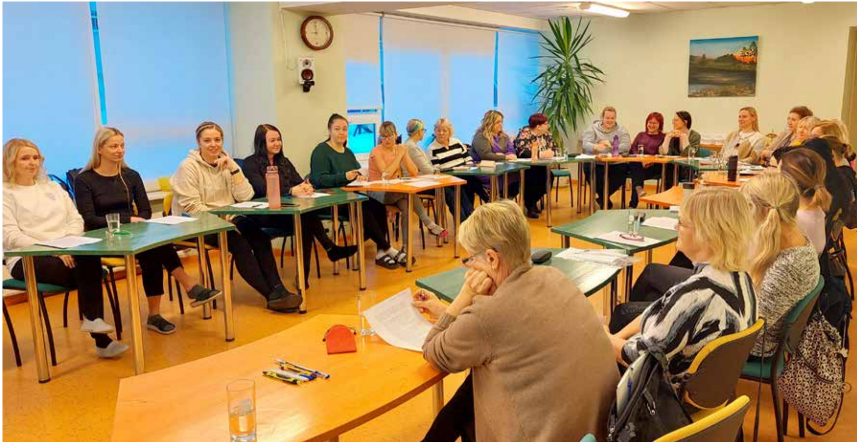
Lasteaia personal meeskonnakoolitusel, mille teemaks agressivsusega toimetuleku ABC.