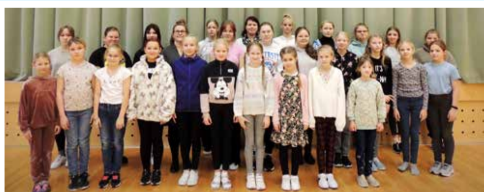
„Jerusalema“ tantsul osalejad.

Vaeval sai line-tantsu projekt lõppeda, kui 27. novembri õõttundidel kell 23.39 ilmus Rakke kooli Stuudiumisse õpetaja Janar Rükkenbergi üleskute: „Pakun terve kooli kõikidele õpilastele väljakutse ja võimaluse osaleda väikeses ühisestantsimises. Tuleb iseseisvalt ära õppida populaarse grupitantsu „Jerusalema dance“ sammud ning tantsime ja filmime selle üheskoos ära 8. detsembril 2023. Kõik, kellel soov osaleda, hakake õppima. Vaatame, kui palju õpilasi Rakke kooli 135-st õpilasest sellest võimalusest kinni hakkab! „Jerusalema tantsu“ kasutatatakse palju pulmades, erinevatel üritustel ja ühisestantsimisel, Youtube's on see üks populaarsemaid erinevate ametite ja asutuste ühisestantsimise väljakutseid. Sammude õppimiseks on aega täpselt kümme päeva, nii et teeme ära! Osalema