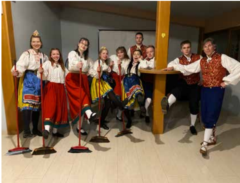
Küprosel ideid jagamas ja kultuuri tutvustamas.