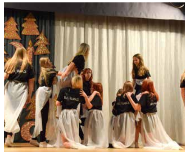
Vanema vanuserühma osalejad esinemas Simuna kooli jõulupeol.