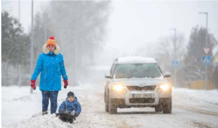
Sõiduta last vaid kõnniteel.

Lapsevanemad, tehke paremini märgatavaks ka lapsevankrid ja -kärrud – spetsiaalsed lapsevankritele mõeldud helkurid või helkurribad