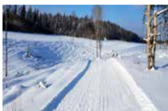
Rakke linnamäel saab mõnusa värskes õhus sporti teha.

Lumikate tekkis sellel talvel lettenägematult varakult ja kahjuks olid Rakke suusarajad detsembris nädalajagu hooldamata, sest olime klubiga Lapimaal suusatamas. Laagrit planeeritakse pikalt ette ja tavaliselt meil detsembril esimesel poolel hästi suusatada ei saa. Nüüd aga, kui ilma on ja tehnika vastu peab, püüan võimalusel rada hooldada. Värsket infot raja olukorrast panen Eesti Terviserade lehele pärast igat hooldust. Hooldust saab