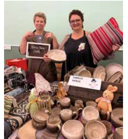
Laadal oli kauplaid lähemalt ja kaugemalt.