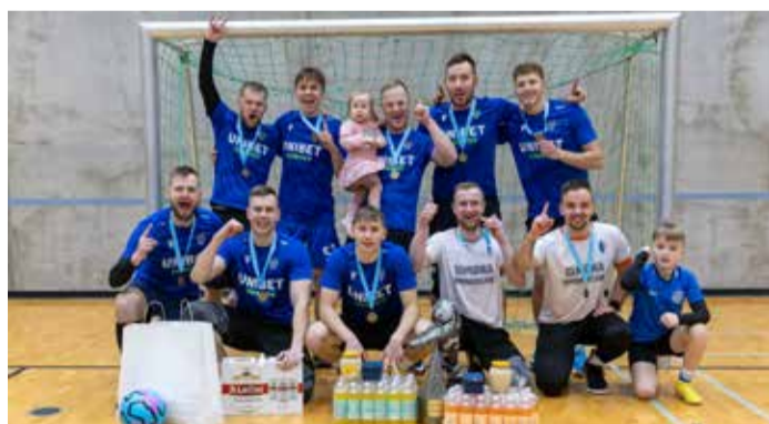
Tasavägisest heitlusest väljusid võitjana meie mehed.

Futsal Cupi peakorraldaja Sten Aru ütles, et turniir oli emotsiooniderohke ja tasavägiste mängudega. „Poolfinaalid ja kohamängud pakkusid põnevust