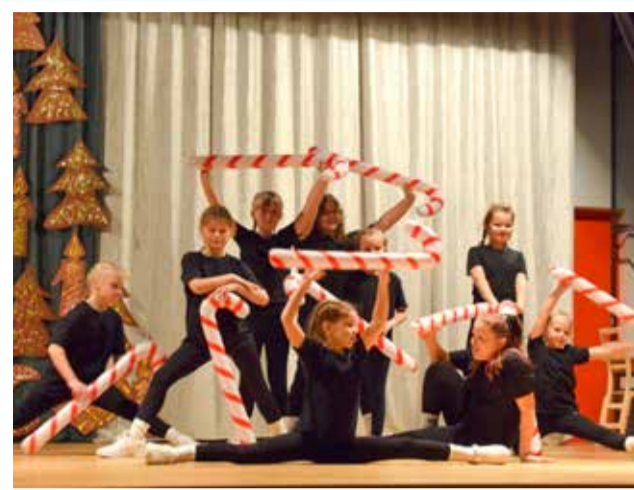
Noorema vanuserühma osalejad esinemas Simuna kooli jõulupeol.

EGLE PENT SIMUNA NOORTEKESKUSE NOORSOOTÖÖTAJA