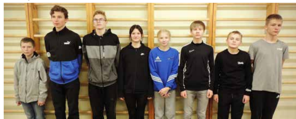
Rakke kooli koondis. FOTO: Janar Ruckenberg

JANAR RÜCKENBERG RAKKE KOOLI KEHALISE KASVATUSE ÕPETAJA