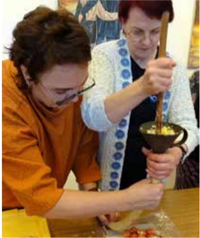
Naisteklubi naised tööhoos.