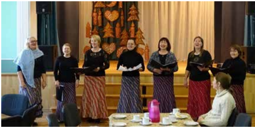
Muusikalist külakosti pakkus Rakke naiskoor.