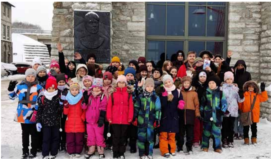
Adam Johann von Krusensterni väljakul uudistati maadeavastaja bareljeefi.

Lisaks virtuaalsele maailmale said õpilased panna käed külge veel teistele põnevatele eksponaatidele. Neist kõige populaarsemaks osutus kindlasti tsükloroom, kus pärismõõtu ratastele pedaalidele vändates selgitati välja, kes on kõige kangem ning kiirem jalgrattur. Aerodünaamiline täpsusmäng aga meelitas neid, kes tahtsid proovile panna