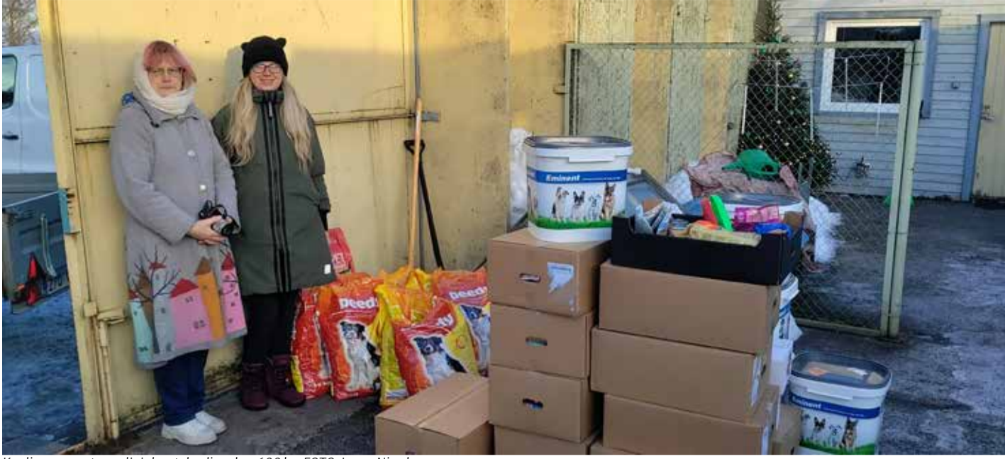
Koolipere annetus neljalajsetele oli umbes 600 kg.