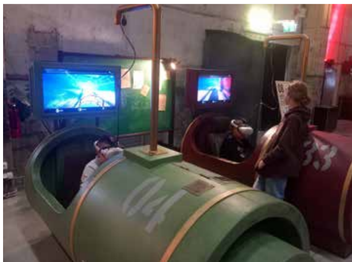
Proto avastustehases oli avastamiseks palju eksponaate.

Pärast seda võis tagasisõit alata – õpilased olid väsinud, aga rõõmsad. Oli üks ütlemata tore ning avastamist täis päev!