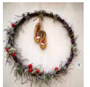
Tantsurühma Kuremarjad valmistatud ja kolmanda koha saanud kaunistus.