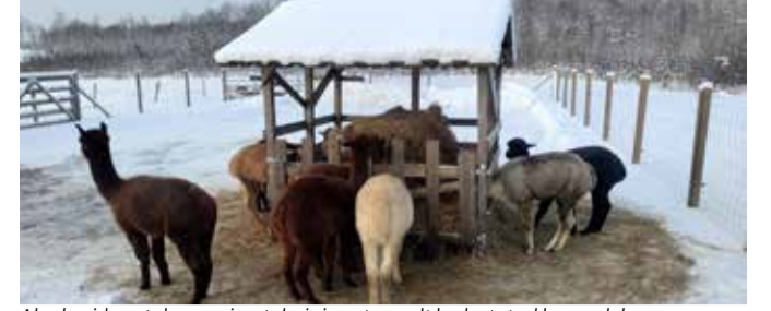
Alpakasid peetakse vanimateks inimeste poolt kodustatud loomadeks.