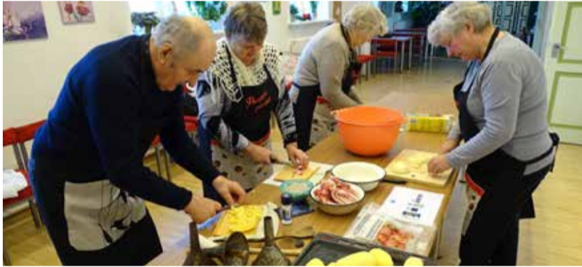
Pasferre prowade õpetasid oma lemmikut kartulivorstikeste varianti.