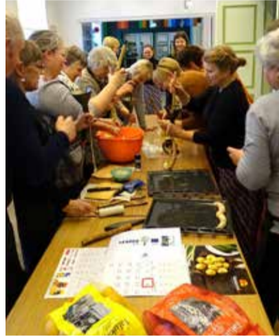
Vorstide valmistamiseks kasutati kohalikku toorainet.