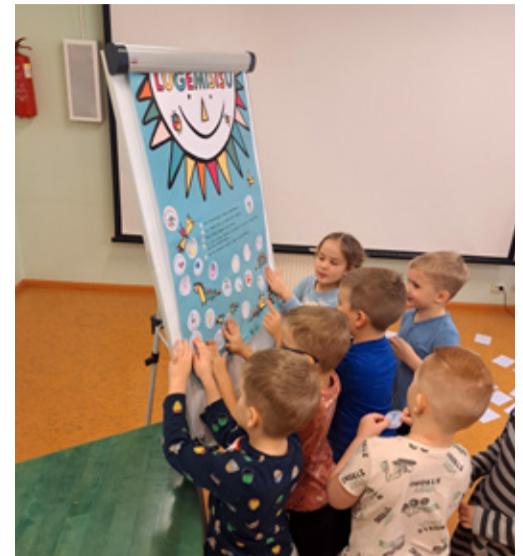
Lugemisisu on suurenenud.

Näitus on avatud Rakke raamatukogu lahtiolekuajal.