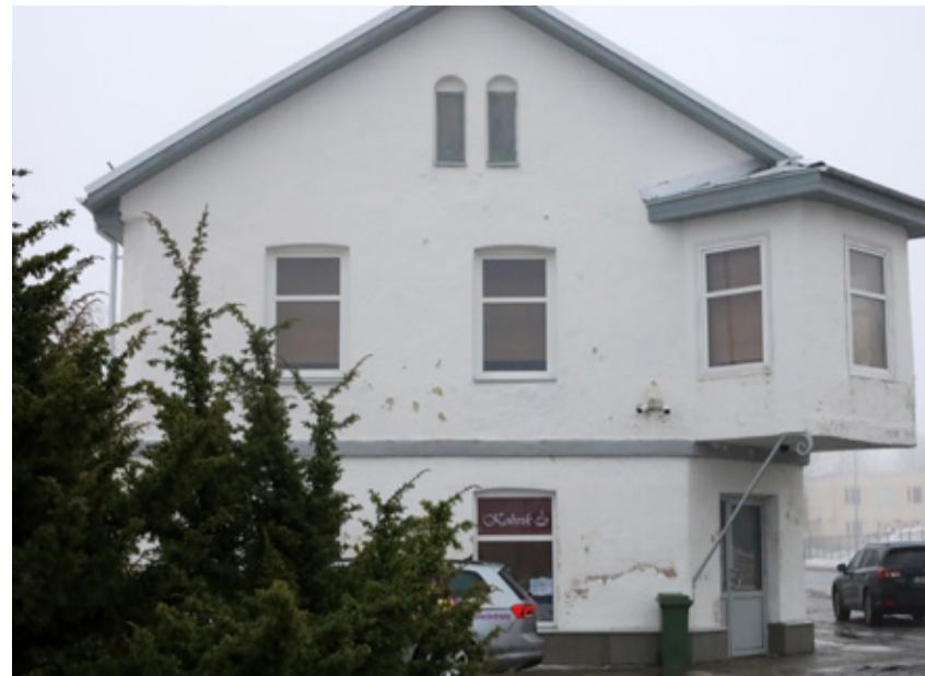
Samades ruumides bussijaama kõrval tegutses varem Kadaka kohvik, mis pani ukseid kinni mullu septembris.

Reelika meenutas naerdes, kuidas proovis ema retsepti järgi kaneelisaiu teha, aga tulemused olid hoopis teistsugused. „Emal tulevad sellised ilusad ja kohevad. Mul olid juba ahjus sellised kõvad. Kui lapsed need kätte said, pidiid ühe ropsuga kolm klaasi piima peale jooma,“ kommenteeris Reelika, kui ta ema parasjagu õhulist pirukatainast