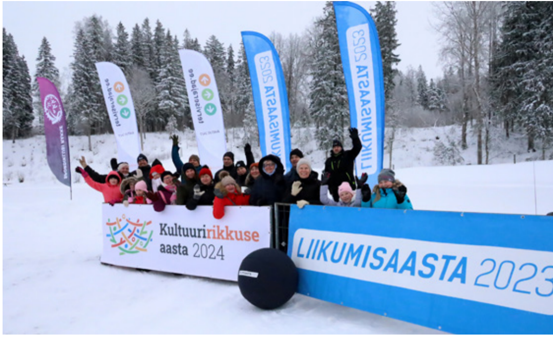
Kultuuririkkuse aasta avasündmus Rakkes.