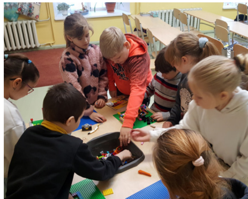
Algkasside klassiruumidesse ja lasteaeda seati üles imelised legolauad.

Oleme ütle mata tänulikud elukoige meie kooli peapäkapikule Merjele ja tema abiliselle õpetaja Erkole.