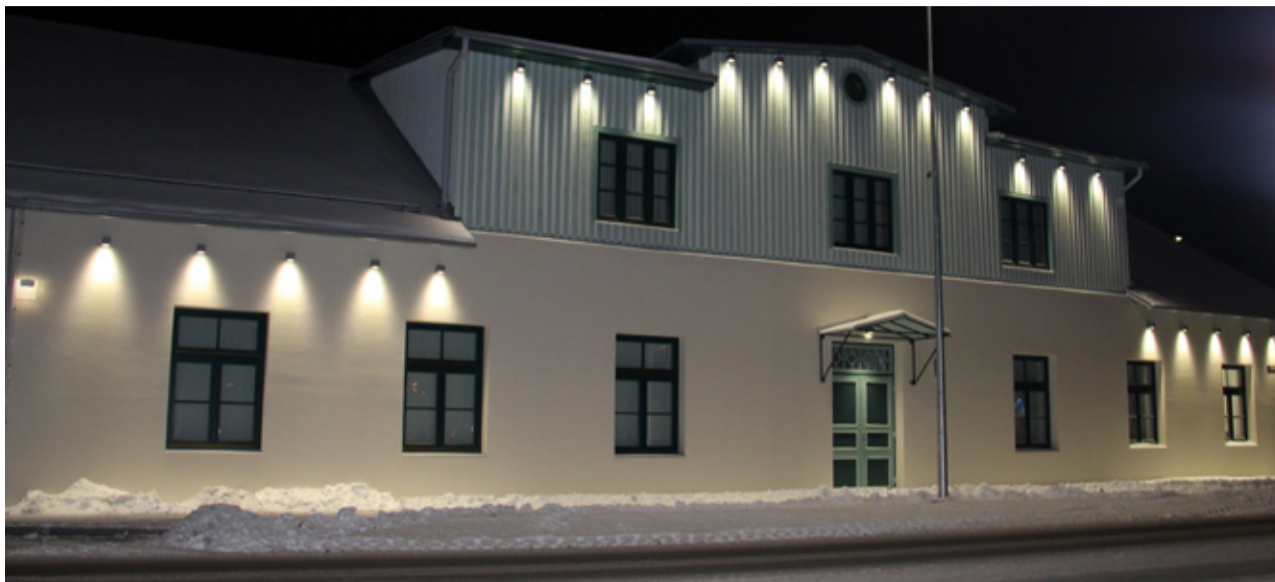
Väike-Maarja tervisekeskus, kus muuhulgas tegutsevad Perearst Mall Lepiksoo OÜ, Perearst Kaja Õunapuu OÜ ja OÜ Väike-Maarja Tervisekeskuse praksised.

Miks on vaja siis üldse Väike-Maarja Tervisekeskust? Sellepärast, et meie lepingupartner