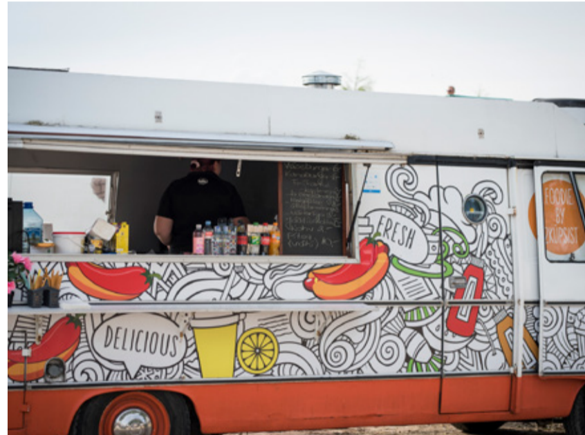
Kiirsöögibussi rooli keeravad naised juba osavalt. Suviti vurab see mööda üritusi ja laatasid.