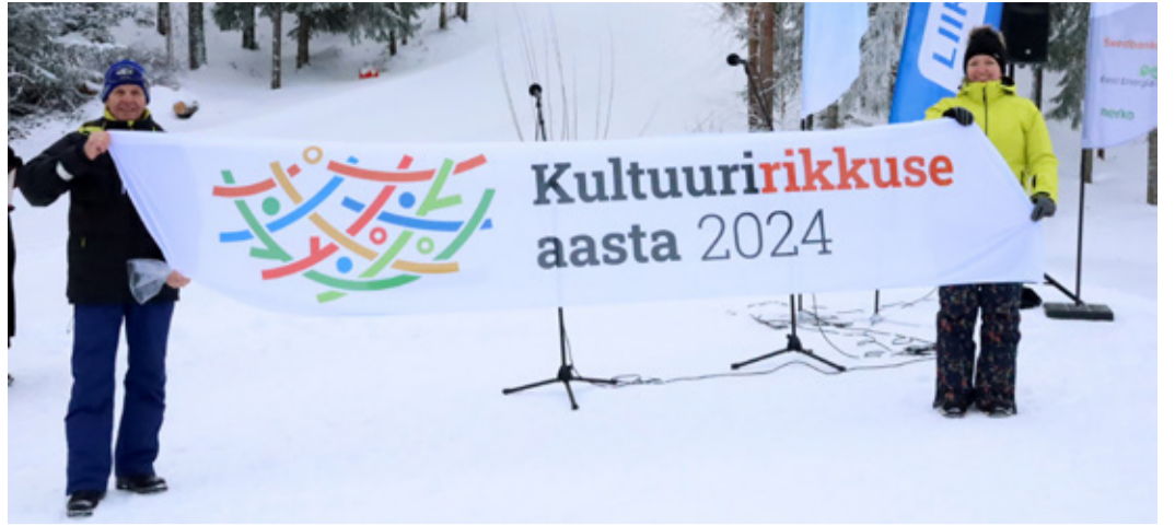
Kultuuririkkuse aasta avasündmus Ebaveres.