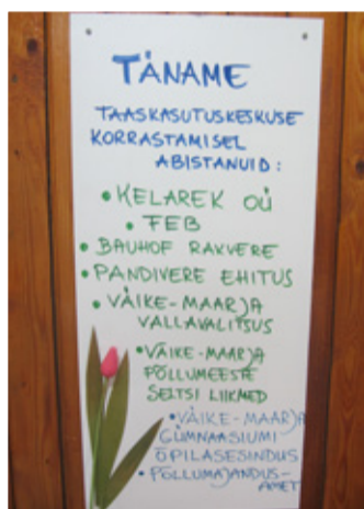
Tänuksilt toetajatega taaskasutuskeskuse seinal aastatel 2015–2016, mil parendati ruumi ilmet ja väljapanekuid.

esemed taaskasutuskeskuses on olnud riided, jalanõud, raamatud, toidunõud jm. Vahendatud on ka suuremõõtmeliste esemete omanike kontakte.