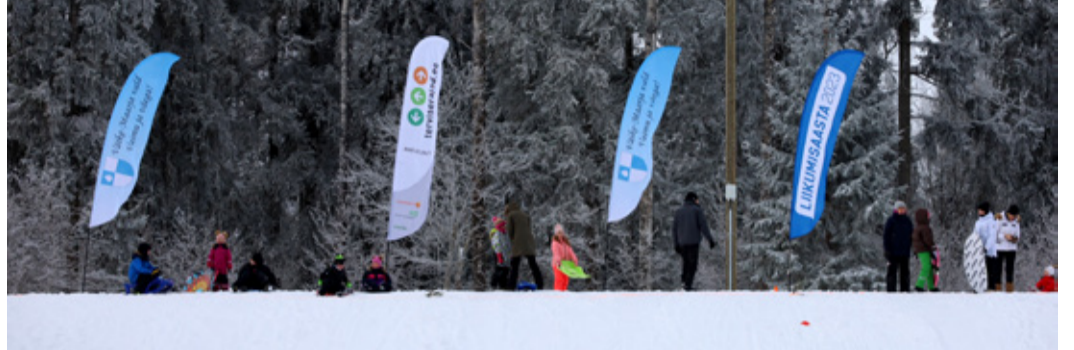
Ebavere kelgumägi.