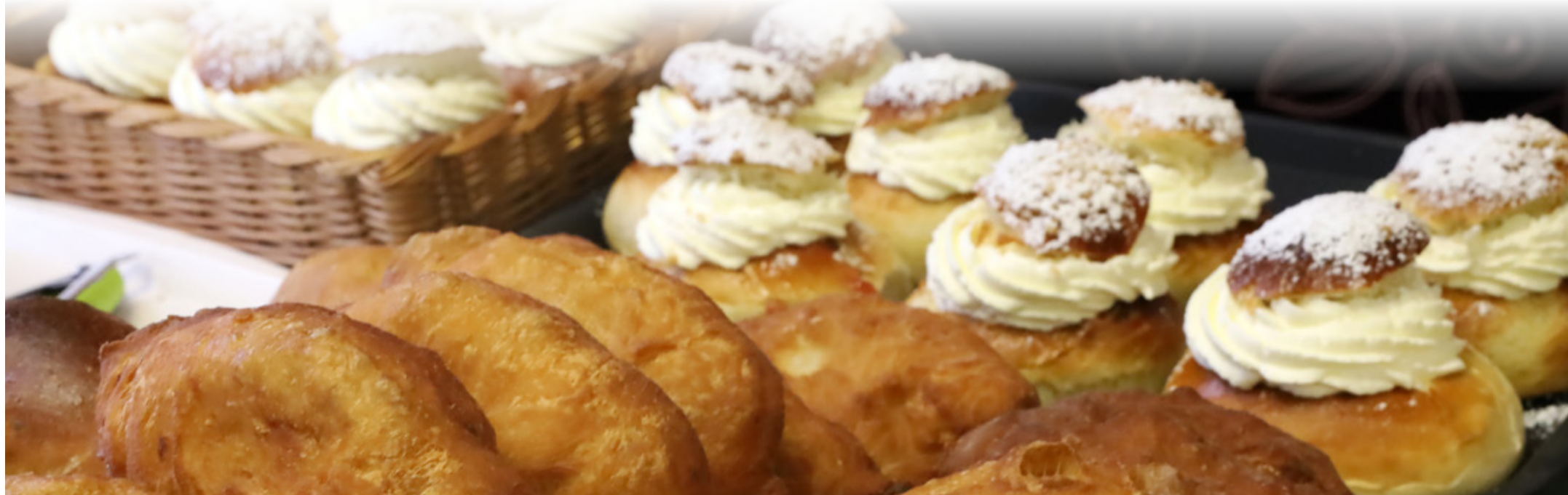
Info maitsevatest pirukates ja vastlakuklitest levis Rakkes kiiresti.