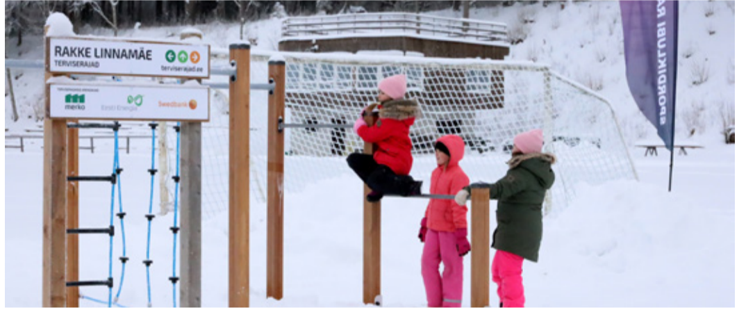
Rakke tasakaalurada.