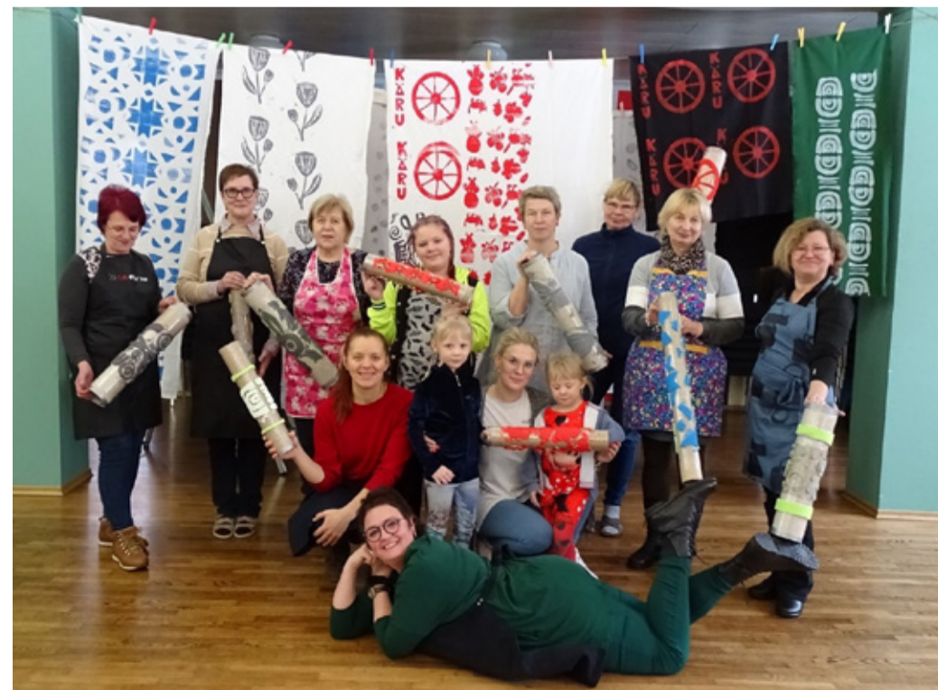
Kohapeal sündisid ainulaadsed mustrid erinevatele pindadele.

Suur tänu kõigile rõõmsatele osalejatele, soojale rahvamajale! Uute kohtumisteni!