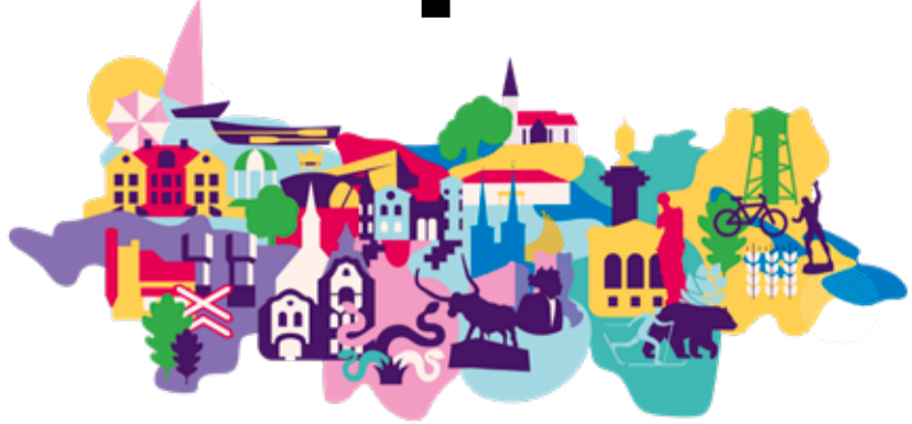
Disainiagentuuri Velvet loodud illustratsioon Lääne-Virumaast.

25. jaanuaril esitleti Rakvere linnavalitsuses Lääne-Virumaa ühtset visuaali ja kohaturundustrateegiat, et paistaksime kahe suure hiiglase – Harjumaa ja Ida-Virumaa vahelt – paremini välja.