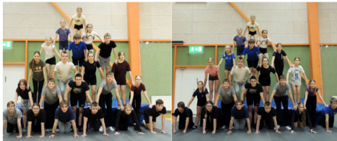
Muljetavaldavalt suur püramiid.

Iga-aastasele kutselisele üritusele saab 41-st kutse saanud õpilasest 35 (85%), mis päris hea osalusaaktiivsus. Moodustasime üheksa erinevat formatsiooni, millest säravaim on kindlasti „Suur