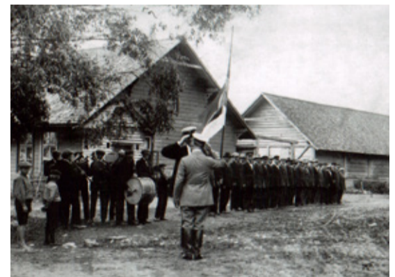
Rakke hobupostijaama hoone, kus 1919–22 asus kool. Põles 1927. Taastatud hoones on praegu raamatukogu.