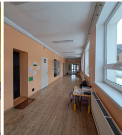
Streik Simuna koolis.