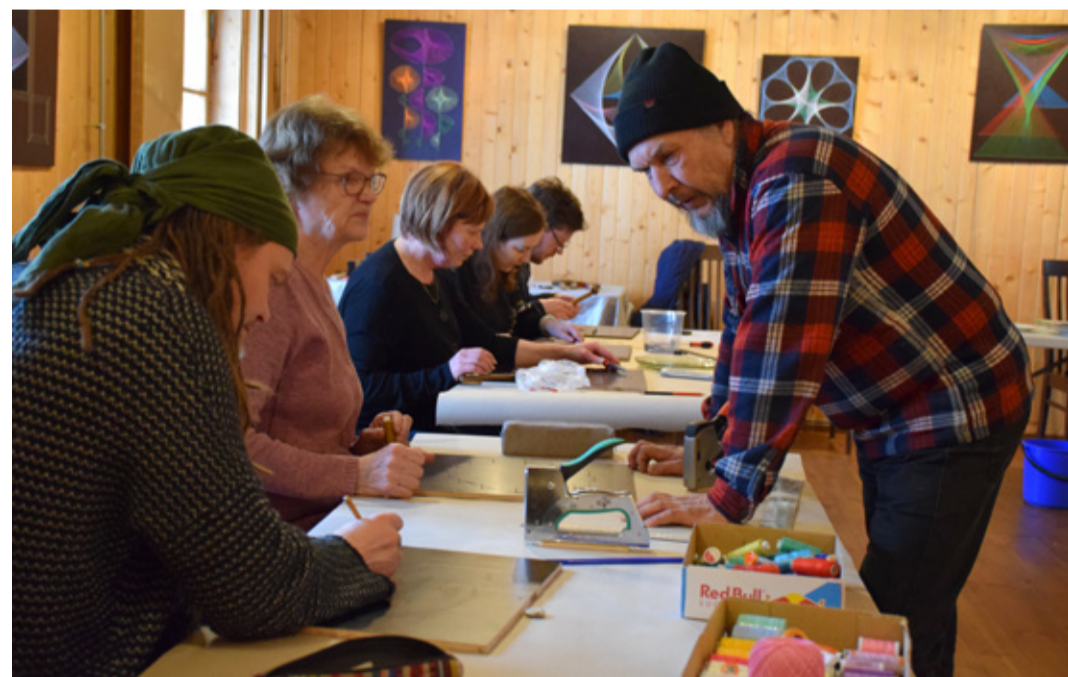
Geomeetrilisi kujundeid saab luua lihtsate koduste vahenditega.

Suur tänu kõigile rõõmsatele osalejatele, soojale rahvamajale! Uute kohtumisteni!