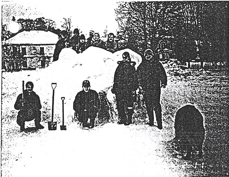
← ↑ Kaks auhinnatud lumekuju