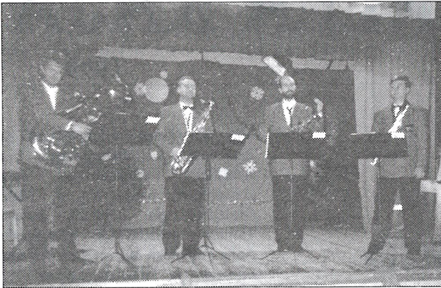
Üllatusesineja – saksofonikvartett