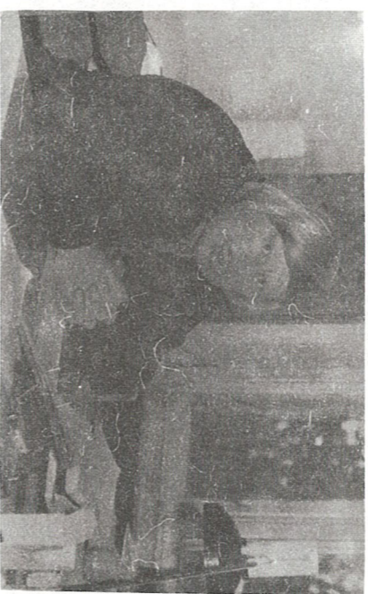
Simunas seati maakonna volikogude saadikute üles Eesti Maaviljeluse ja Maaparanduse Teadusliku