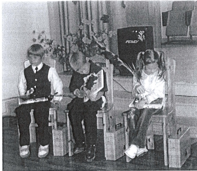
Küll see esimene aabits on ikka huvitav- uudistavad Lahu algkooli lapsed

Tähtis hetk- minu esimene aabits- hetk Rakke Gümnaasiumis