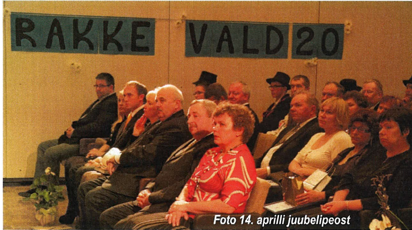
Foto 14. aprilli juubelipeost

Aktiivne külaharvas on ka Salla piirkonnas, kus tähistati märtsis Salla Mõisa Seltsi 10.