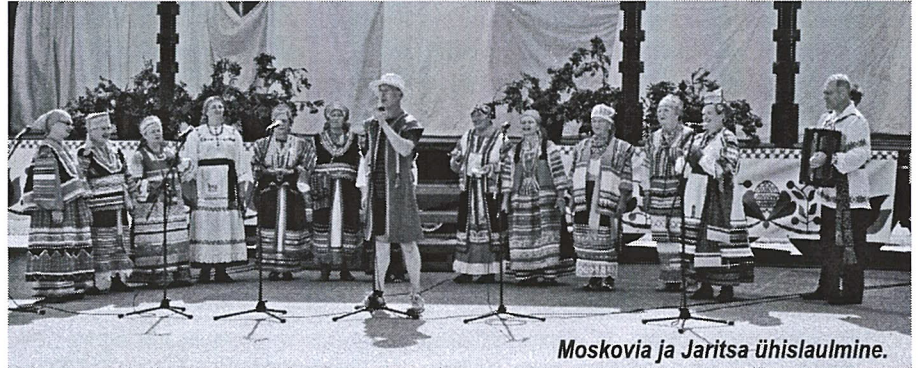
Moskovia ja Jaritsa ühislaulmine.

Sergijev Possadi linnast ehk endisest Zagorskist pärit laulukollektiiv Moskovia pakkus lisaks oma rahvalaulule kaunist silmailu, kus igal lauljal olid seljas oma piirkonna rahvariided, neist õhkus uhkust oma paikkonna ja kultuuri üle.