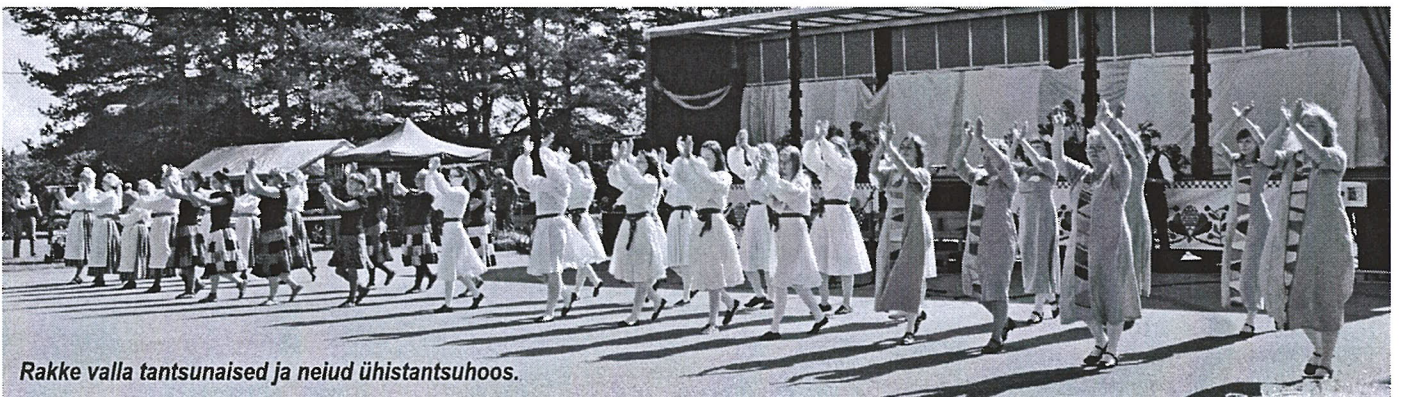
Rakke valla tantsunaised ja neid ühistantsuhoos.