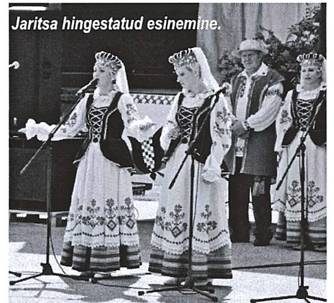
Jaritsa hingestatud esinemine.