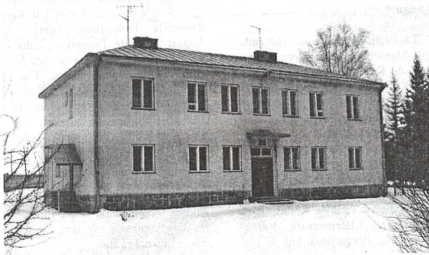
A.Kotli poolt projekteeritud koolimaja avas oma ukse 1940.a.

Rakke Gümnaasiumi uue õppeaasta avaaktus 1.septembril kell 9