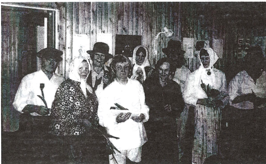
Haridusseltsi liikmed Oskar Lutsu näidendis "Pastlad"