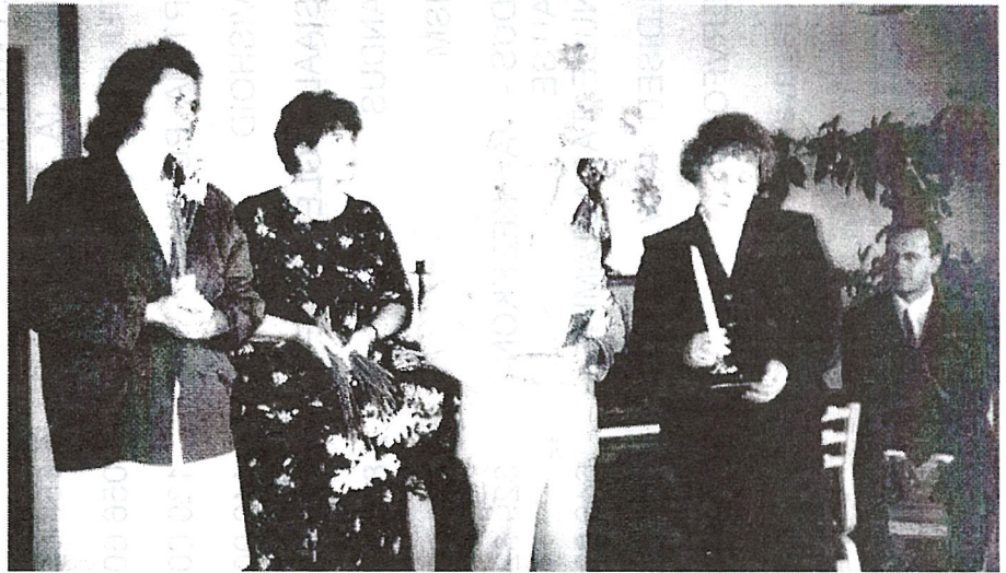
Rakke haridusseltsi liikmed Koeru raamatuklubi Vaimuvalgus juubelil

Järelkasvule mõeldes sai teoks kooliõpilaste omaloomingu võistlus. Muuseumis oli võimalus tutvuda 19.-20. sajandi õppekirjanduse väljapanekuga.