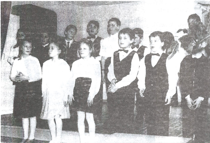
Lahu kooli lapsed esinemas Karl Ernst von Baeri 210. sünniaastapäeval

Lahu Algkooli näitering on juba kolmandat aastat kihelkonna näiteringide päeval teistel pinnuks silmas, sest nad esinevad nii hästi. Kahel eelneval aastal on saadud esikoht ja tänavu teine koht.