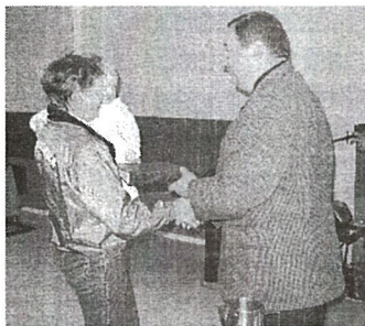
Vallavanema õnnitlused Sirli emale ja koolidirektori tugev käepigistus Gedi-Ly emale