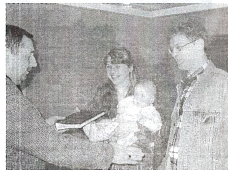
Jaan oma röömsate vanematega