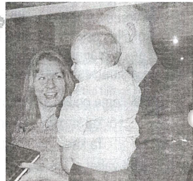
Helle Katrina vanematega