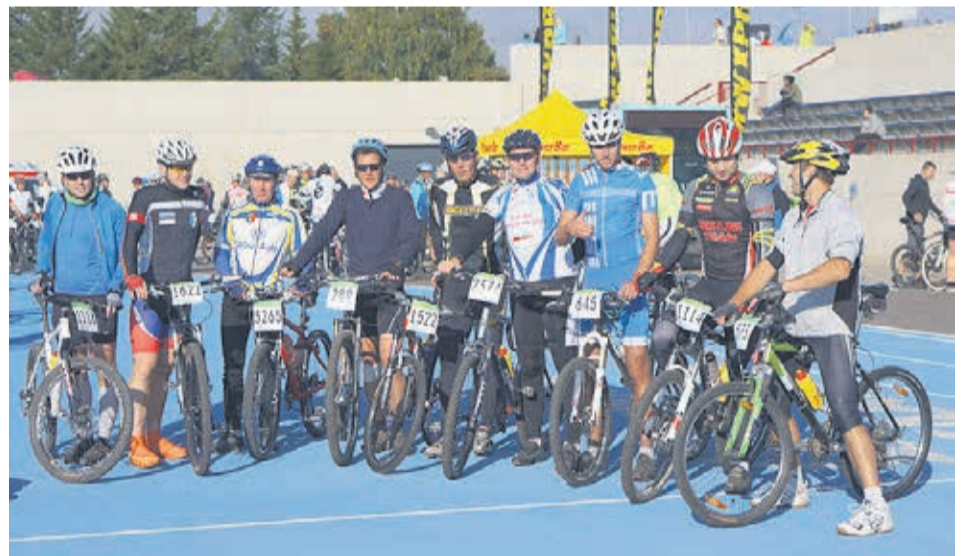
Hetk enne Tartu rattamaratoni starti.

Simuna spordiklubi põhiline spordiala on olnud läbi aastate korvpall. Nii on see ka sellel aastal, Simunast mängib neli korvpallimeeskonda Lääne-Virumaa erinevates korvpalliliigades. Meistriliiga jaoks pandi kokku võistkond Simuna parematest poegadest, kes katsuvad rammu seitsme vastasega Lääne-Virumaalt. Esiliigas pallib Simuna Artiston ning teises liigas Simuna