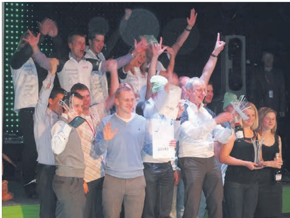
Klubide autasustamine Tartu Neliküritusel

Tänavune aasta on olnud Simuna spordirahvale igati edukas, on põhjust rõõmustamiseks ja rahuloluks.