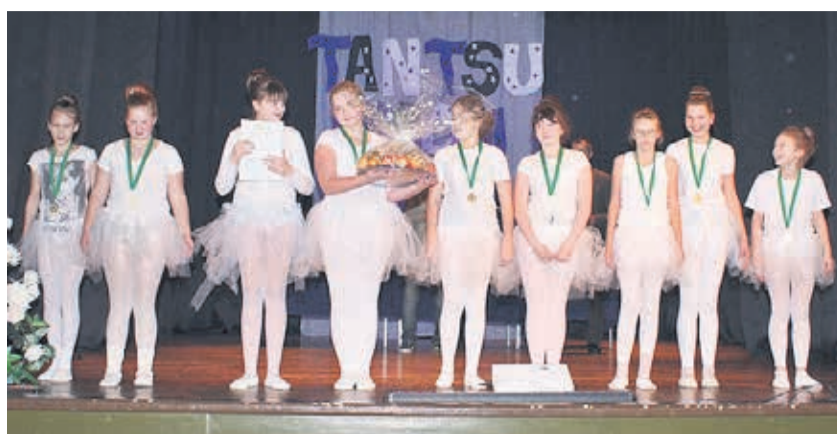
5. klass.

4. detsembril toimus 13. korda Väike-Maarja gümnaasiumi 5.-12. klassi tüdrukute tantsupidu. Sellel aastal oli