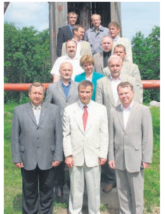
Meenutus Pandivere piirkonna koostöölepe allkirjastamiseremooniast 2005. a. Emumäel.

Nagu ma eespool juba ütlesin, ei olnud Väike-Maarjas elukeskkond selle laiemas tähenduses kolhoosi ajal sugugi halb. Sellel ajal loodul baseerub ju suuresti ka praegu vallale kuuluv infra-