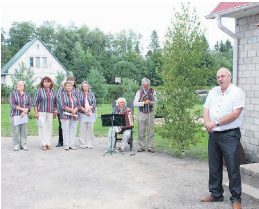
Maavanem Einar Vallbaum Eipri külamaja avamisel.

muusikafestival jätkavad Väike-Maarja kõrge musikaalsuse taseme tõestamist ning innustavad noorsugu selles valdkonnas end täiendama ja edasi liikuma. Muusika kõrval on olulised ka kultuurisündmused, teatrifestivalid, seltside üritused ja sünnipäevad ning aktiivsed külakogukonnad. Siinjuures tuleb esile tõsta ka Eipri külamaja avamist sel aastal.