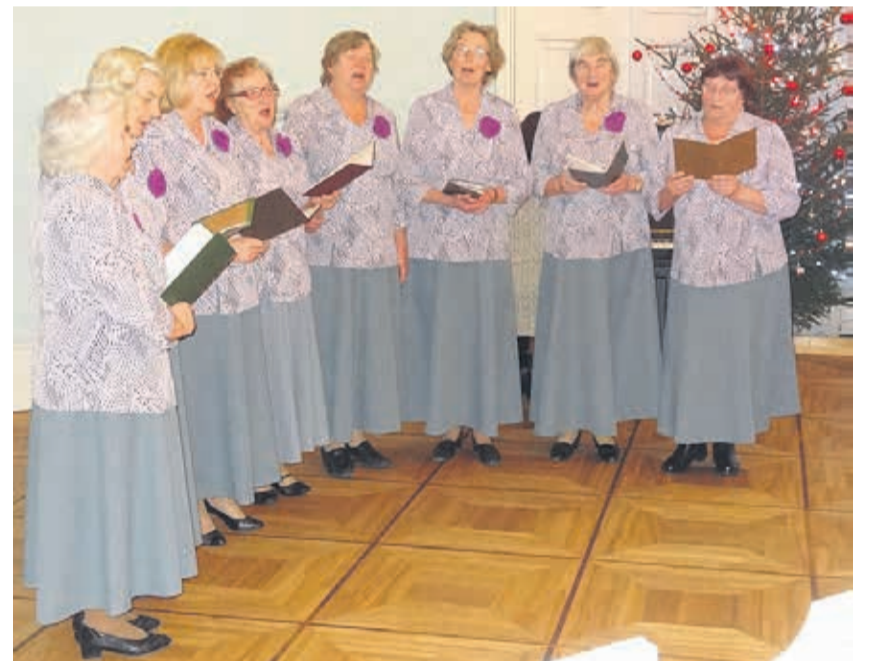
Kiltsi laulumemmed valla aastapäevaaktusel.