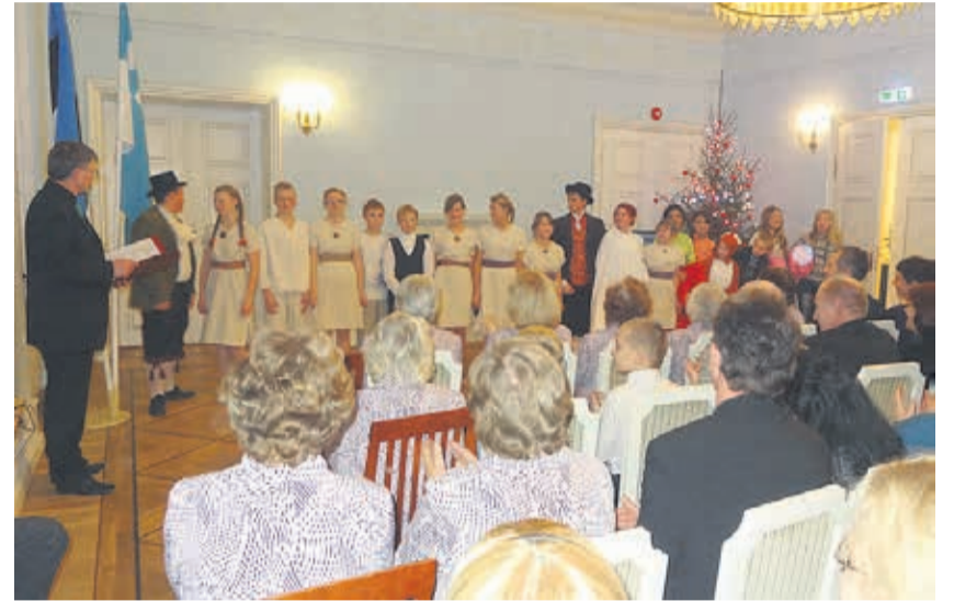
Kiltsi õpilased elustasid näitemänguga mõisalegendi.

Väike-Maarja gümnaasiumi noormehed pakkusid toreda tantsuelamuse. Klaveril esitas omaloomingulisi palu motosportlane Indrek Mägi, laulurõõmu pakkusid Kiltsi lasteaialapsed ja laulumemmed.