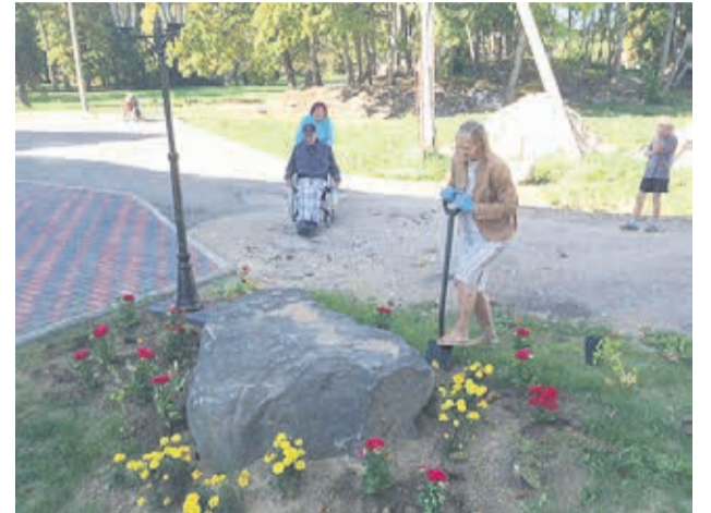
Pargi korrashoidmisel saavad ka hoolealused abiks olla.