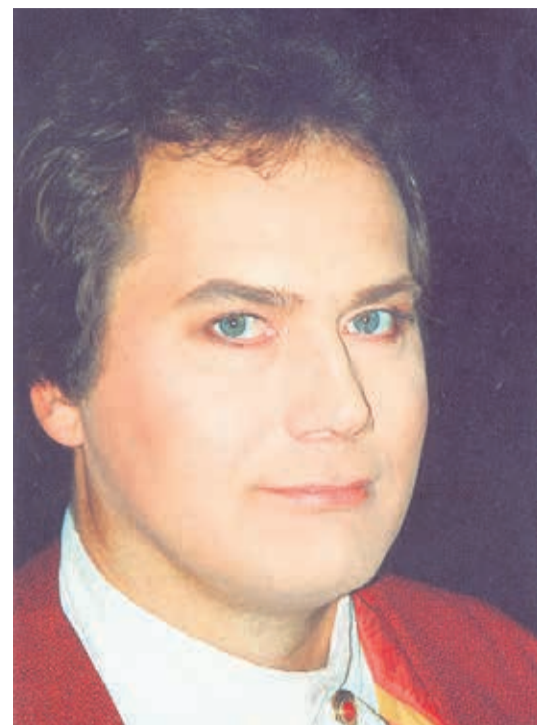
Caramello – J. Strauss „Õo Veneetsias“ (Eine Nacht in Venedig), 2000.

Vello Jürna lauljate näitust on võimalik vaadata detsembri lõpuni Väi-