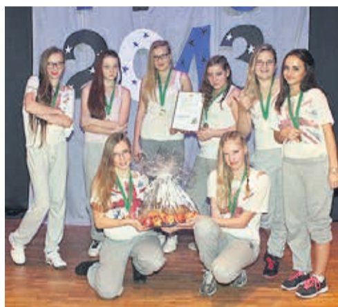
8.b klass.

4. detsembril toimus 13. korda Väike-Maarja gümnaasiumi 5.-12. klassi tüdrukute tantsupidu. Sellel aastal oli