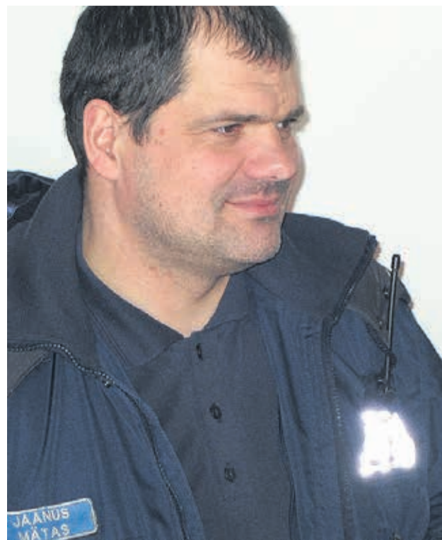
Rahulikke jõule ja ilusat uue aasta algust!

Koostöö on märksõna, mis on edukuse aluseks. Jätkakem koostööd, mille tulemusel tunnete iseennast turvalisemalt.