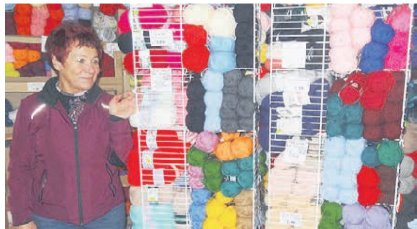
Käsitöötajatele pakub huvi poe lai lõngavalik.

Poest võib leida mitmesuguseid kingitusi, keraamikatooteid, vaase, lil-