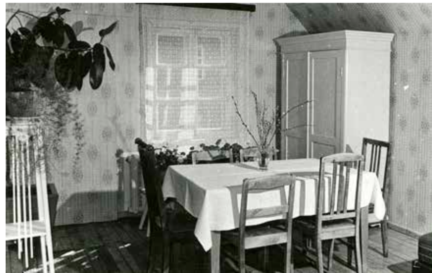
Väike-Maarja muuseum, aprill 1988. Kolhoos „Kevade“ loomise tuba.

2. aprillil 1988 toimus Väike-Maarja Muuseumi avamine. Lindi lõikas läbi ärklikorruuse trepimademel Boriss Gavronski. Rahvast oli palju, sest olid alanud Väike-Maarja kolhoosi 40. aastapäeva pidustused. Kohale olid kutsutud kõik kolhoosi asutajaliikmed. Lisaks ülemise korruse põhiekspositsioonile oli all praeguses klassiruumis fotonäitused asutajaliikmetest ja kolhoosi elust tegevusalade kaupa.