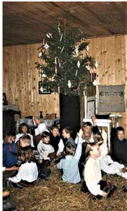
Väike-Maarja muuseumi jõulutoas 18. detsemberil 1996.

Muuseum sai aidata ka kohalikke inimesi. Maareformi rakendamisel oli võimalik muuseumist saada andmeid oma esivanemate talude kohta. Meil olid arhiivist välja kirjutatud andmed kõikide Vao ja Assamalla valla (s o Väike-Maarja kihelkonna) talude kohta. Lisaks sai mõnigi endine taluperenaine meie kaasabil tõestada pensioniks