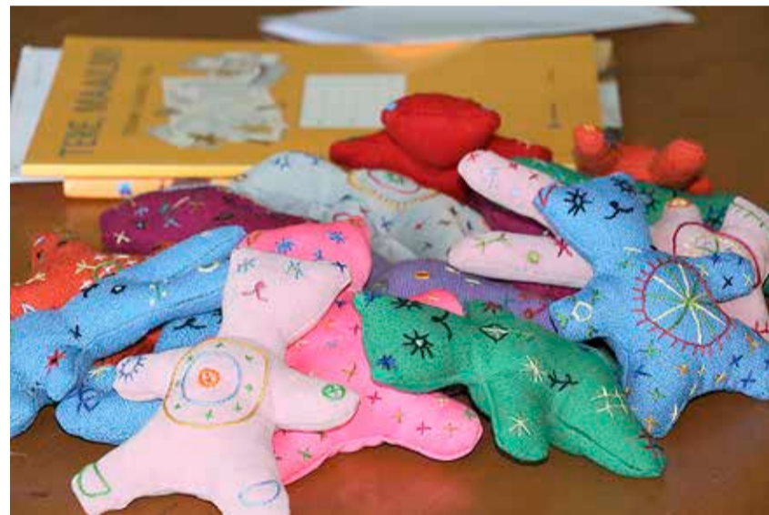
Röömsad pihuloomad.