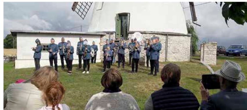
Väike-Maarja Pasunakoor Võivere tuuleveski õuel.

et traditsiooniliselt avatud talud leiavad igal aastal küllastajatele elamuse pakkumiseks uue nüansi. Näiteks toi-