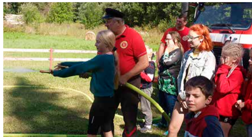
Noored tule kustutamist harjutamas.

„isepöörleva“ propelleri valmistamist. Koos lauldi lõkke ääres erinevaid tuntuid laule. Kogu selle melu juurde käis ka muidugi jäätise söömine ja kiikumine.