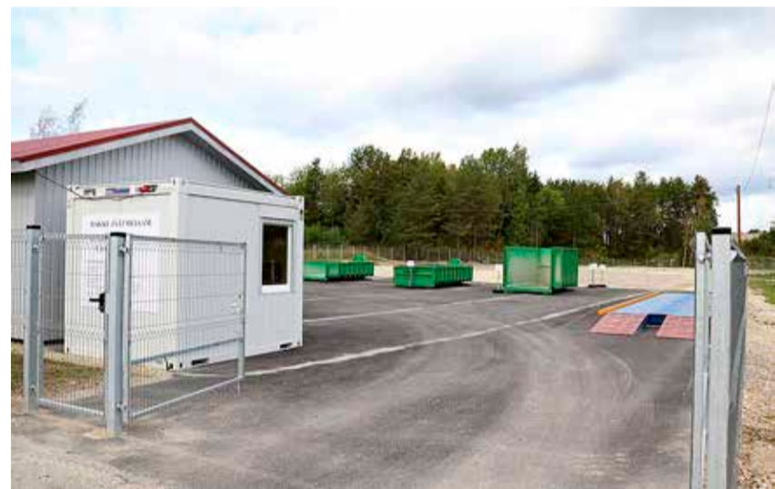
4. septembril avatud Rakke jäätmejaam.