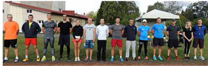
Memoriaal 2019.