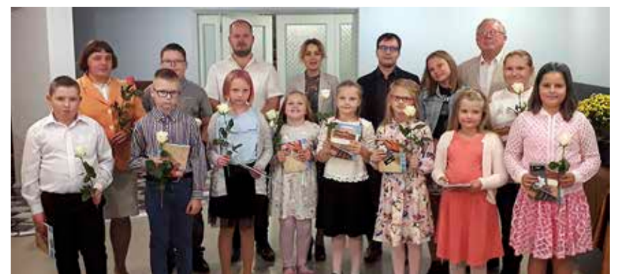
Rakke filiaali avamisel 3. septembril. Pildil Rakke õpilased ja õpetajad.