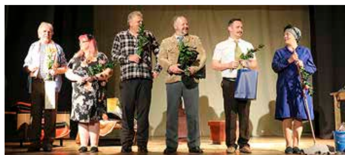
„Provintsianekdoodid“ pälvis suure rahva aplausi.