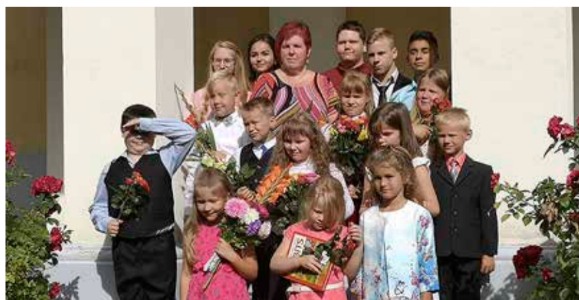
Kiltsi Põhikooli aktusel 1. ja 9. klass.