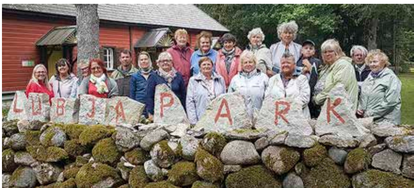
Lümanda lubjapargis.