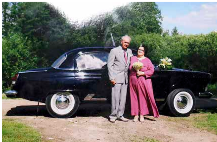
Lapsed korraldasid kuldpulmalistele üllatuspeo.