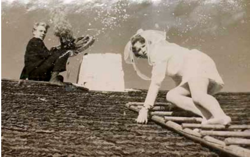
Igasugu julgustükke tuli noorpaaril pulmamees teha.

Ka Väike-Maarja ja Rakke valla liitmisest suhtub paar väga positiivselt. „Paistab, et kõik toimib nüüd ilusasti: tänavad on korras, Kase parki uuendati, jäätmejaam alles avati, uus kauplus tehti lahti. Kui Väike-Maarjaga ühinesime on olukord palju parem. Kõik on