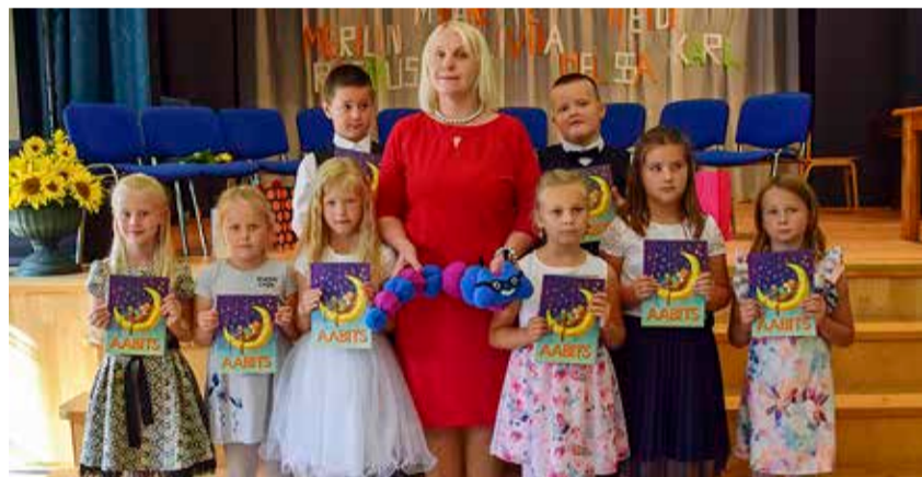
Simuna kooli 1. klass 1. septembril.

Väike-Maarja vallavolikogu ja vallavalitsus soovivad õpilastele, õpetajatele, koolitöötajatele ja lapsevanematele edukat, huvitavat, avastusterohket ja tulemuslikku kooliaastat!