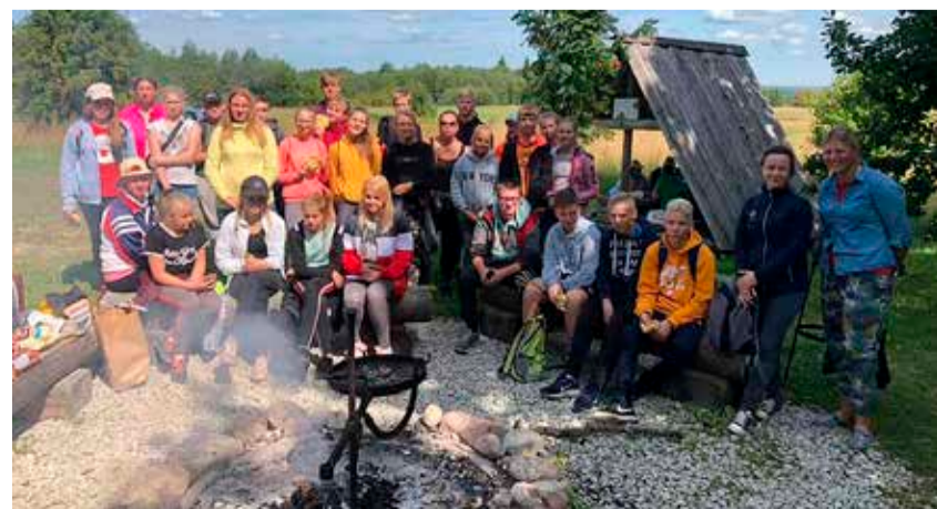
Maleva II vahetus Emumäel grillimas.