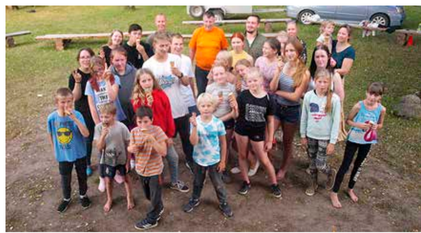
Laagrilised ühispildil.