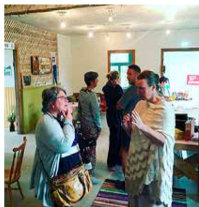
Uudistajad Salla Seltsimajas.

nist „Rehetuba“, kus kokku kleebitud ja ringlema pandud kassetilindid põleva tule, sauna ja rehepeksu hääletega tekitasid erilise atmosfääri. On kindel, et