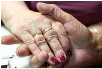
Viiekümne aastast liitu tõendab veel üks sõrmus.

toolidena ja tehti aknad lahti. Minul kah hakkas paha, no nii kuum oli ja rahvast oli kah tohutult palju," konstateeris Valle. „70 inimest oli kindlasti," nentis Aimar. Abielulepingule kirjutasidki noored alla istudes. „Aimaril olid kõik higitsevad otsa ees ja vaatasin, et ta vajub kokku. Mul aga kleit väris,“ meenutas Valle naerdes.