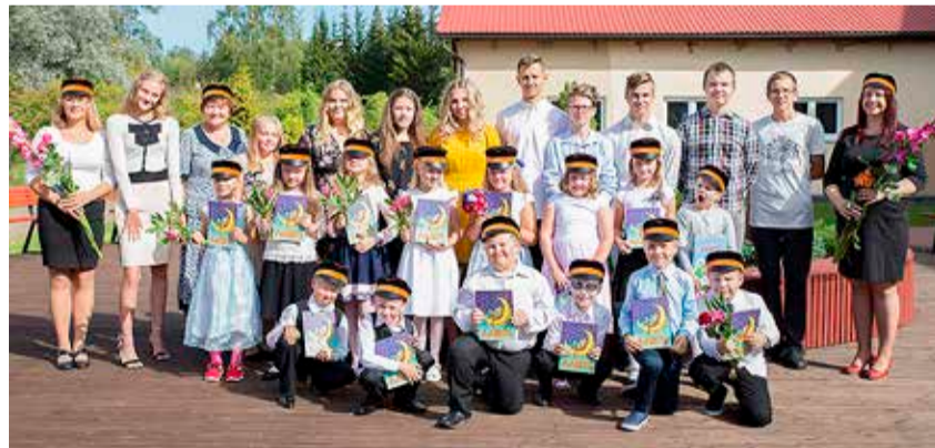
Rakke kooli 9. ja 1. klass. avaaktusel.