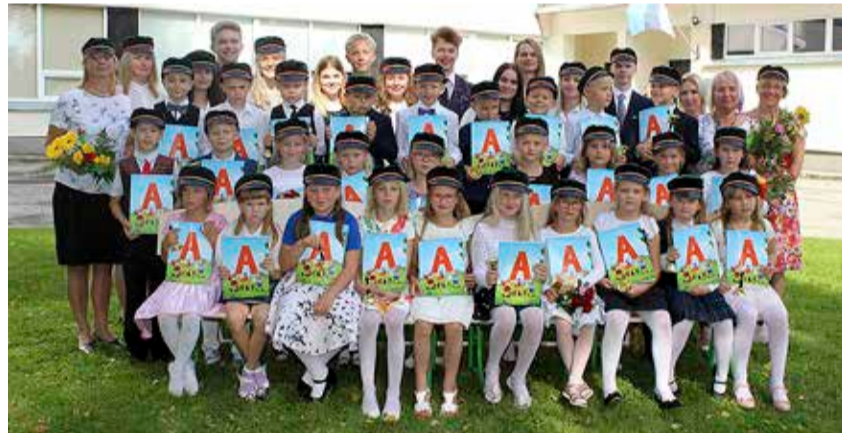
Väike-Maarja gümnaasiumi 1. klassid ja 12. klass.