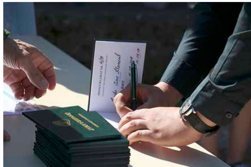
Koolisümboolikaga kõvakaanelisse matriklisse tuli igal kümnendikul anda oma allkiri.