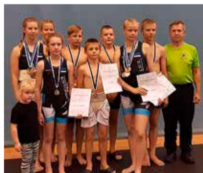
Jõu katsumine Rakvere spordihoones.