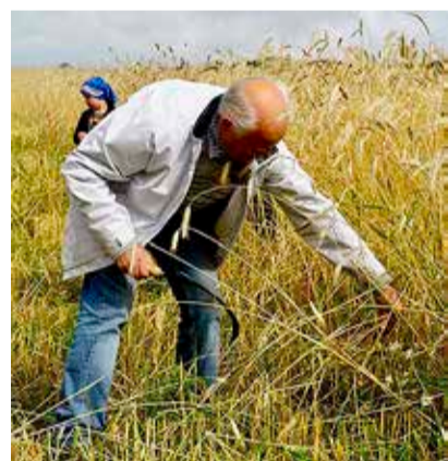
Toomihkli talus sirbiga vilja lõikamas.

mus Toomihkli talu sissepääsu juures rukkipollu ääres rukkivihkude tegemise õpituba, mida juhendasid spetsialistid põllumajandusmuuseumist. Rukist lõigati omaaegsel traditsioonilisel meetodil – sirbiga ning soovijad said proovida vihu tegemist. Kruusiaugu talu pakkus vana rehetoa külalistele võimaluse osa saada Günter Kitse loodud ainulaadsest akustilisest installatsioo-