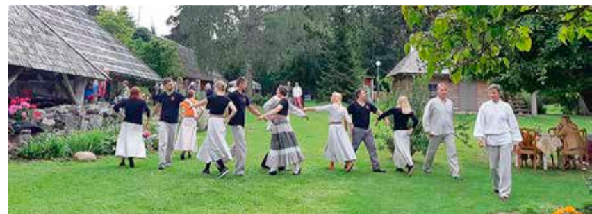
Tantsuselts Tarapita Oruveski talu hoovil.

Taludes olid avatud kodukohvikud ja kaasa sai osta kohalikke tooteid. Oruveski talu veiselihasupp söödi oodatust kiiremini ja õhtuks oli ka lõkke kohal küpsetatud lammas otsas. Kaasa osteti Pärt-Jaagu talu kama, paljud proovisid kamakohvikut pakutud toite ka kohapeal. Kruusiaugu talu esimeste küllastajate Facebooki-postitus tekitas lumepalliefekti kohalike Pavlova kookide huviliste hulgas. Tuuliku talu juures pidas kohvikut Simuna külmuivatamise tehase Freezedry. Näkiuurimiskeskuses valmistati külalistele maitsvat eranditult kohalikust toorainest.