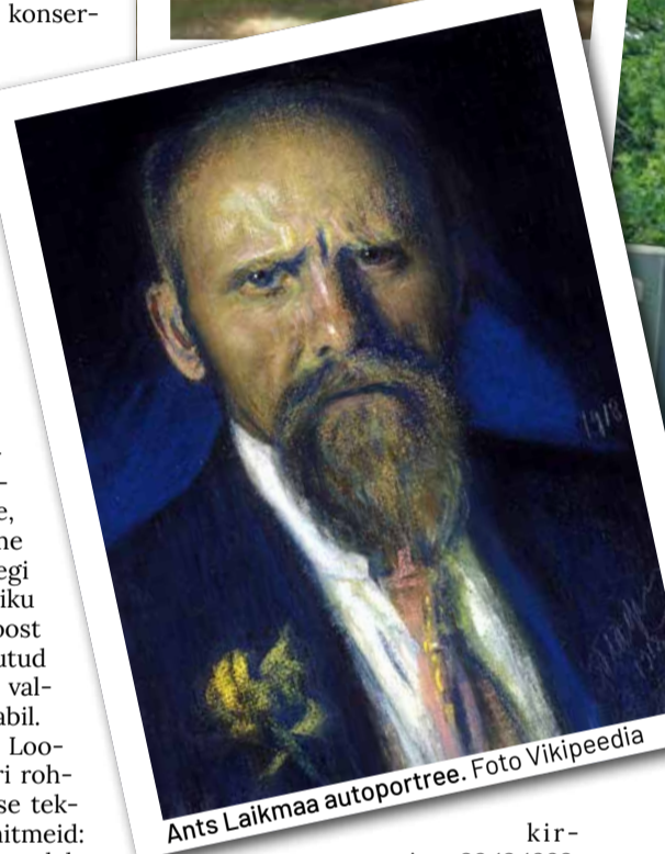
Ants Laikmaa autoportree.