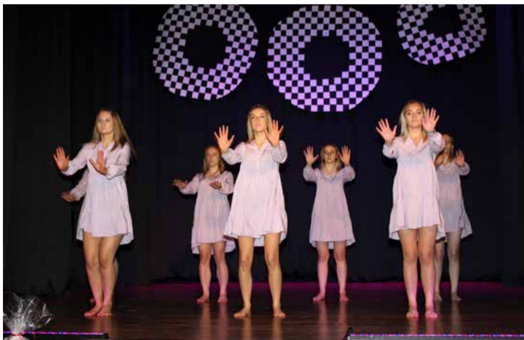
Tüdrukute tantsupeo tähtsaima auhinna võitnud 11. klass.