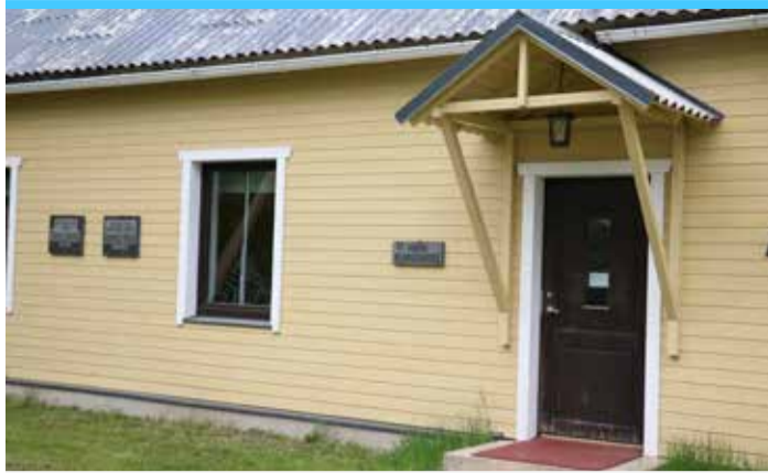
Rakke raamatukogu.