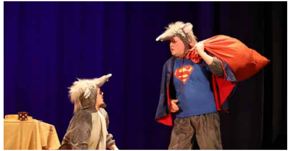
Etendus „Võlukook ja Superrott“.

Mis sai detsembrikuust? Kuna novembris hakkas taas koroonaa teine laine pead tõstma, kehtestati uued piirangud ning iga ürituse toimumine oli suure küsimärgiga. Väga hoolikalt tuli hakata jälgima, mis valitsus otsustas. Nii hakkasidki vaikselt kõik