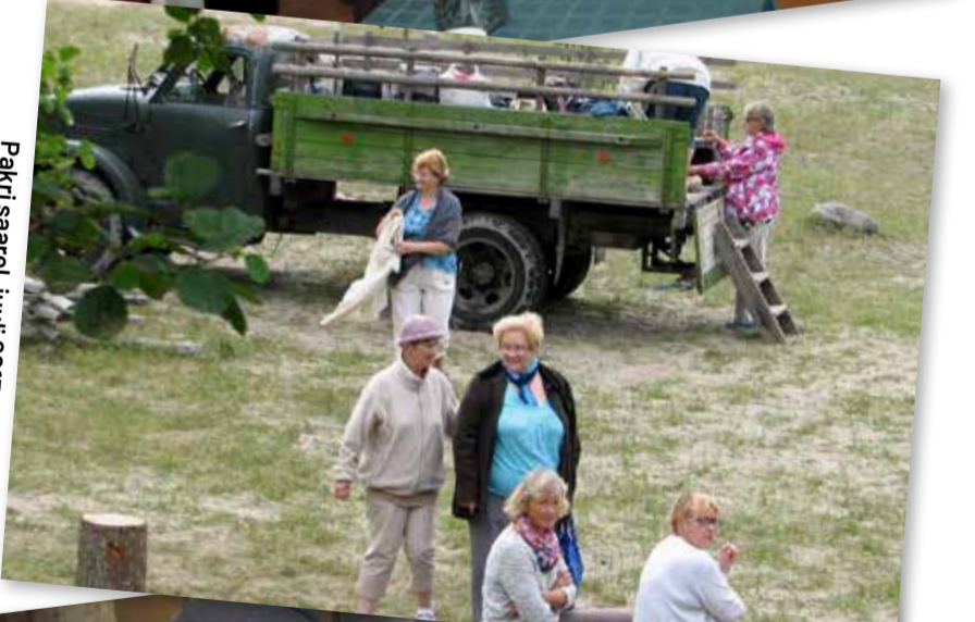
Pakri saarel, juuli 2015.