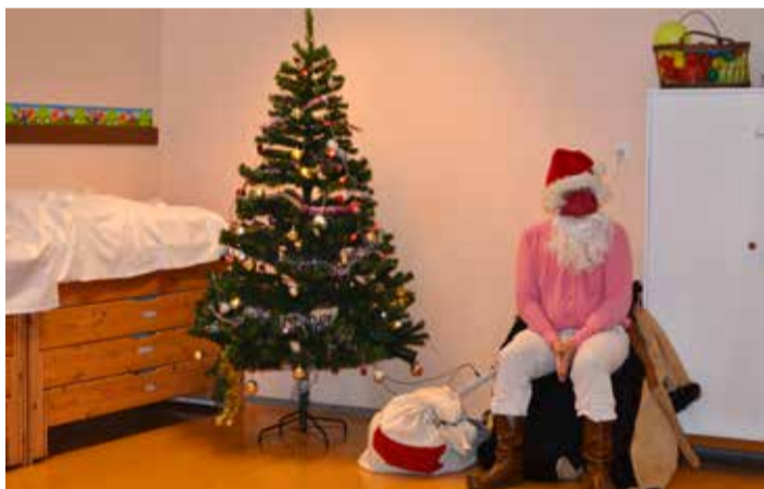
Jõuluvana Simuna lasteaias.