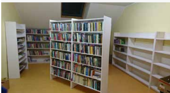
Triigi raamatukogu sai mugavad ruumid.