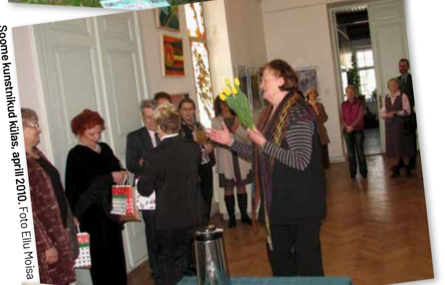
Sooma kunstnikud külas, aprill 2010.