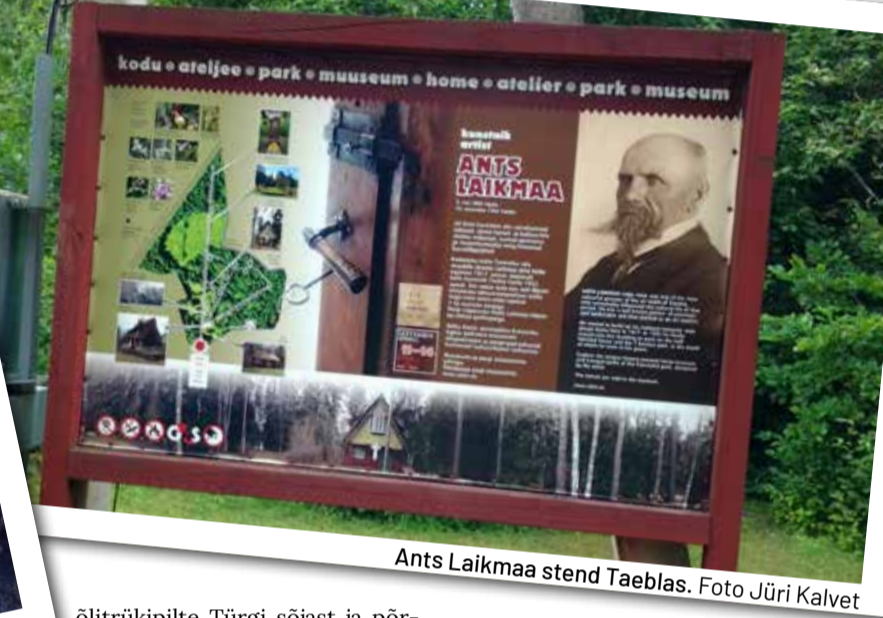
Ants Laikmaa stend Taeblass.

õlitrükipilt Türgi sõjast ja põrgupiinadest. Need kirjeldused Laikmaa noorusest ja õpingutest Eestis, Riias, Saksamaal, Peterburis, ja terve eluloo on kirja pannud Endel Nirk oma raamat „Kaanekukk“. Sissejuhatavas osas kirjeldab ta kunstniku 1936. a autoportree valmimist ja Laikmaa enda selgitust sellele: „Iga inimese elus on tema elulugu ja draama, mida ainult kunstniku silm näeb ja ta sulg või pintsel võib kirjeldada, kokku võtta ja teistele, kes kirjaoskajad, lugeda anda võib.“