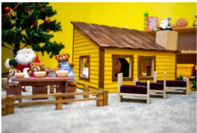
Loovtööna valminud nukumaja.

Pilvi Preisfreund Mesimummide rühma õpetaja