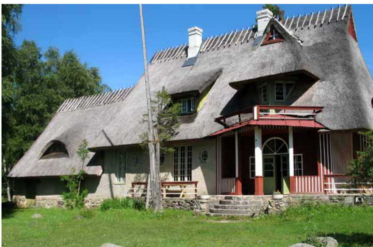
Laikmaa majamuuseum.

kir- ja 28.12.1992. a, kuid ehitustööd ja materjalide kogumine võtsid aega ja esimene näitus avati 1998. a juunis.