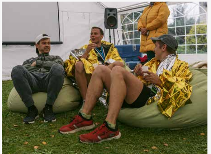
Esikolmik naudib päeva.