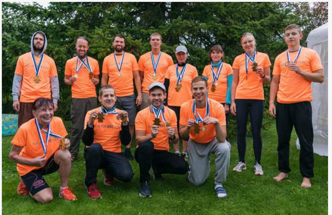
Väike-Maarja maratonist osavõtjad (puudub Urmas).