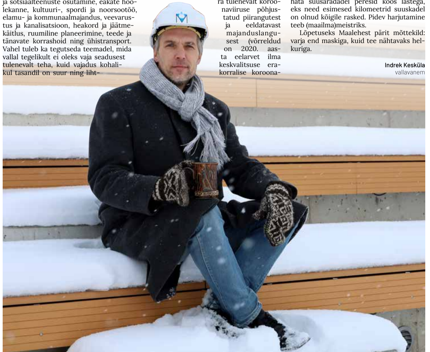
Eelarve eelnõus on korralik väljakutse: ehitusaasta 2021. Mõistlikus koosmeeles on see teostatav.