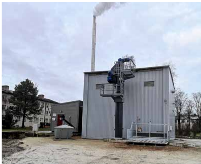
Rakke Metsa tn katlamaja.

SW Energia on olnud Rakke aleviku soojatootja juba alates 2016/2017 hooajast. Kuna senised katlamajad olid amortiseerunud ja ebaefektiivsed, alustas SW Energia 2020. aasta aprillis Rakkes Metsa ja Staadioni tänaval asuvate katlamajade kaasajastamist. Kasutades kõige kaasaegsmaid tehnoloogiaid, said siiani gaasi- ja õlikütetel töötavatest katlamajadest biokütusel (hakkepuidul) sooja tootvad katlamajad. Täna vastab nii Metsa