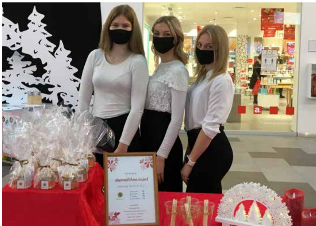
ÕF K&E&A.

Eelmisel õppeaastal loodi Eestis 450 õpilas-