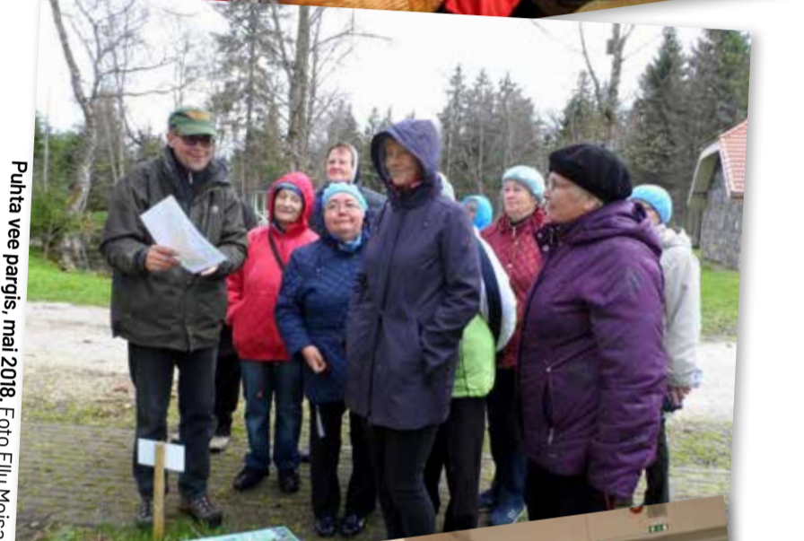
Puhta vee pargis, mai 2018.