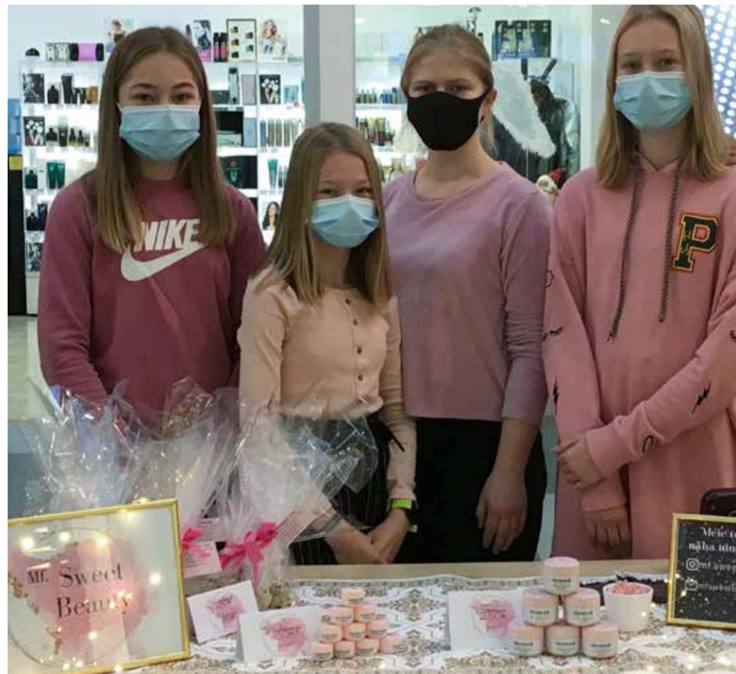
MF SweetBeauty.