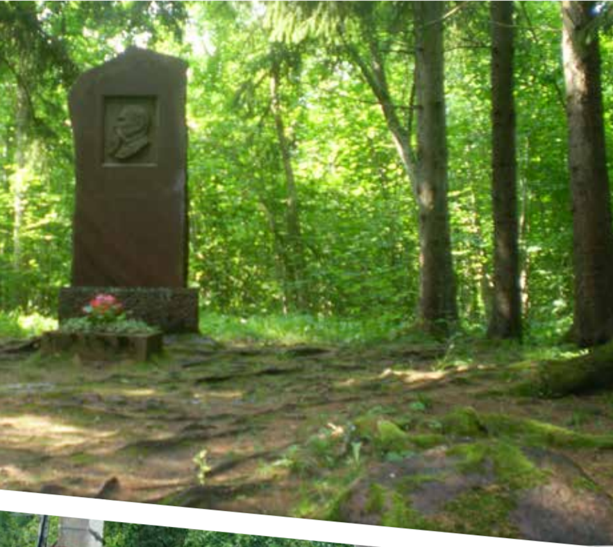
Ants Laikmaa haud.