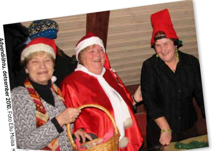
Adventõhtu, detsember 2010.