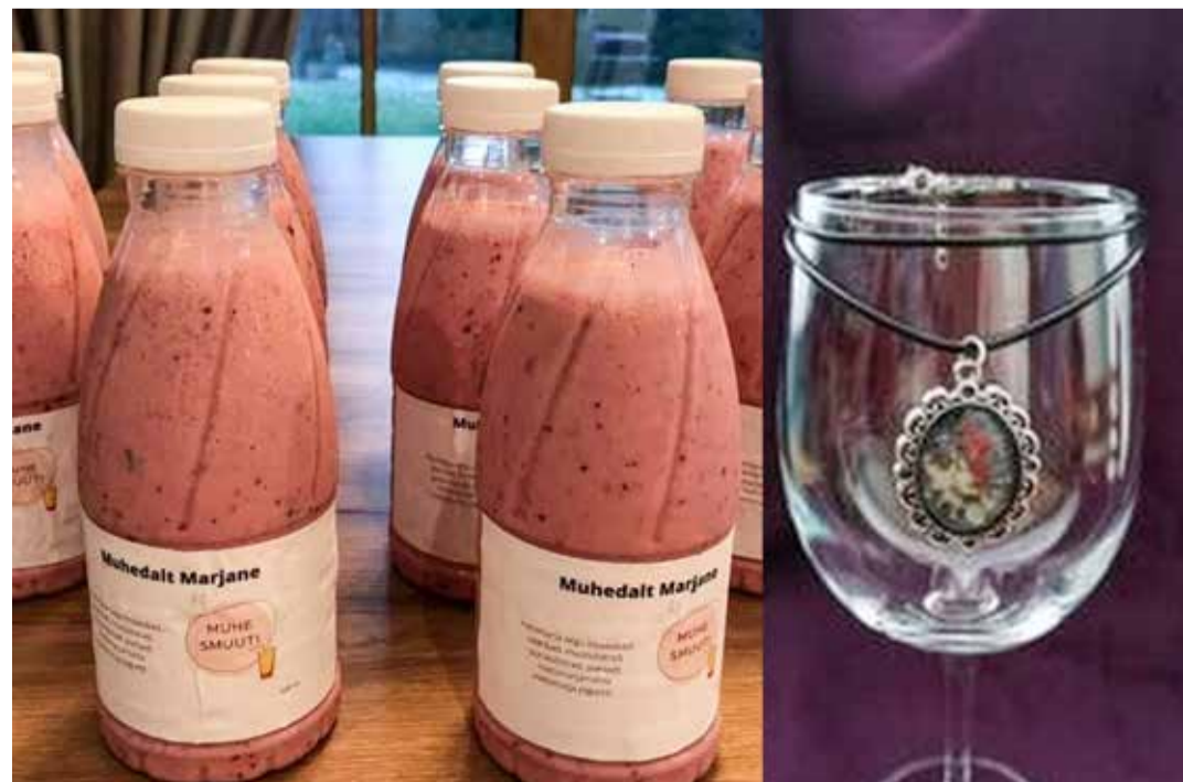
ÕF Muhe Smuuti ja MF Käsitöö-eided.