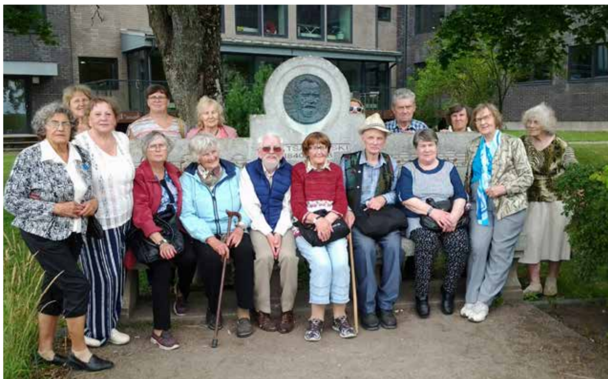
Haapsalus Tšaikovski mälestuspingil.