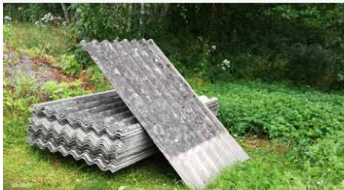
Eterniiti on kasutuses kui niisama vedelemas üsna palju.