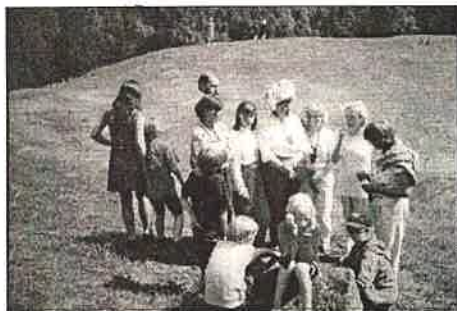
Perekond REONDA suurte perede kokkutulekul Vana-Võidus

Meie riigi üleminekuperiood on nõudnud oma osa, avaldades väheses laste sündivuses, lahutuste ja üksikvanema perede arvu suurenemises. Seda suurem roll lasub neil lapsevanemail, kes on mõelnud meie riigi tulevikule ja otsustanud luua paljulapselise perekonna, s.o. pere, kus kasvab 4 ja enam alaealist last.