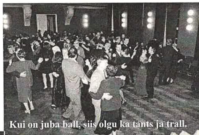
Kui on juba ball, siis olgu ka tants ja trall.