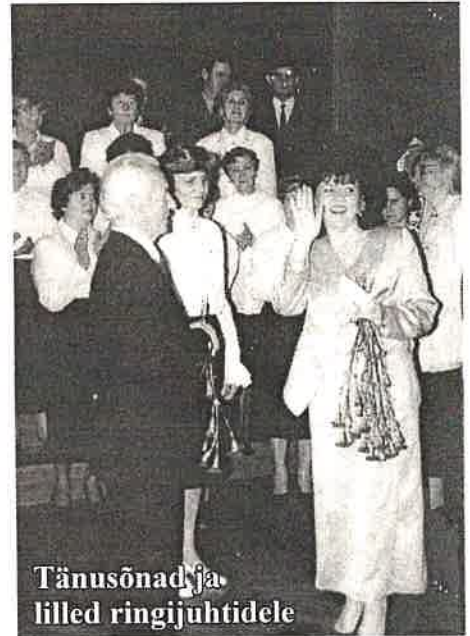
Tänusõnad ja lilled ringijuhtidele