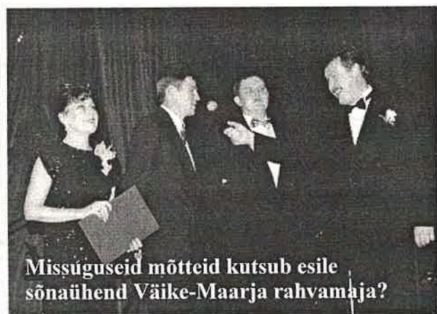
Missüguseid mõtteid kutsub esile sõnauhend Väike-Maarja rahvamaja?