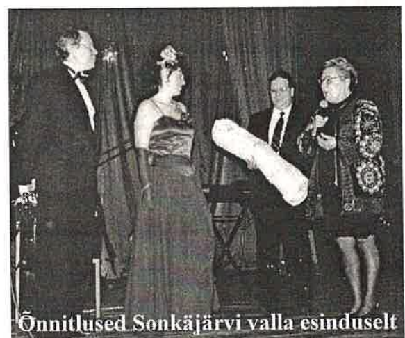
Õnnitlused Sonkajärvi valla esinduselt